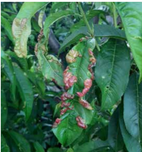
Рис. 1.5. Ознаки прояву кучерявості на листах

Хвороба проявляється у вигляді ураження листків, що деформуються, нерівномірно розростаються, мають ненормальний гофрований вигляд і червонувато-рожеве або світло-жовте забарвлення (рис. 1.5.). Молоді листки віком 8-10 днів вже мають її ознаки. За розміром уражені листки значно більших розмірів, ніж здорові. Це пояснюється значним збільшенням у них клітин палісадної та губчастої паренхіми. З нижнього боку листкової пластинки формується білий воскоподібний наліт – сумчасте спороношення гриба [28].