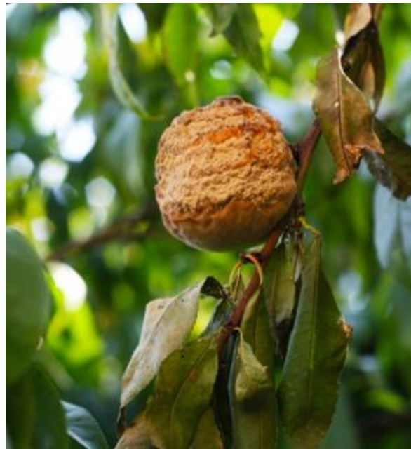
Рис. 1.3. Симптоми прояву моніліозу на персику [43]

Плодова гниль проявляється пізніше, з літа по осінь, у фазу дозрівання та плодоношення. На уражених плодах з'являються бурі плями, які швидко розростаються по всьому плоду. На поверхні можуть утворюватися світло-сірі подушечки конідіального спороношення збудника. Плоди зморщуються, часто муміфікуються [48].