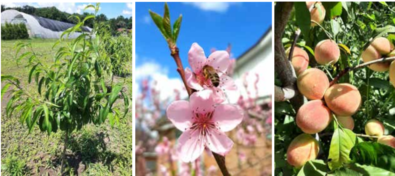
Рис. 1.1. Молоде дерево персика (ліворуч), квітка персика (посередині), плід персика (праворуч)

Плоди персика є найбільшими з усіх плодів кісточкових дерев. У багатьох сортів плоди в середньому важать 150-200 г, відзначаються своїми смаковими якостями та специфічним ароматом. Також необхідно відзначити високий вміст в них поживних речовин, вітамінів та мінералів. Персик містить органічні кислоти: яблучну, винну, лимонну, солі мікроелементів. До вітамінного комплексу плодів входять: вітамін С, Е, К, РР вітаміни групи В, каротин, мінеральні речовини – калій, кальцій, магній, фосфор та мідь.