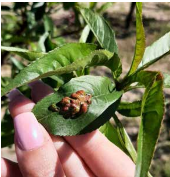
Рис. 3.1. Перші симптоми прояву кучерявості листків персика Айс Піч після цвітіння

На молодих листочках, що тільки почали розпускатися, спостерігаються місця з деформацією тканин, їх вздуття, нехарактерний для здорових листків колір від світло-жовтого до яскраво червоного (рис. 3.1.).