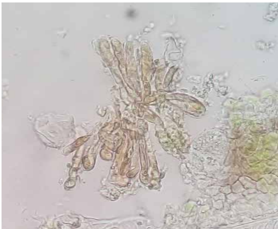
Рис. 3.3. Taphrina deformans (сумчасте спороношення ,x40)

Представники роду Taphrina мають декілька визначних особливостей (рис. 3.3.). Плодові тіла та структури безстатевого спороношення вони не утворюють, міцелій розвивається в тканинах заражених рослин. Міцелій складається з двоядерних клітин. Клітинні стінки двошарові. У деяких видів формуються добре розвинуті гаусторії. При спороношенні міцелій формує шар під кутикулою рослини, клітини якого проростають асками.