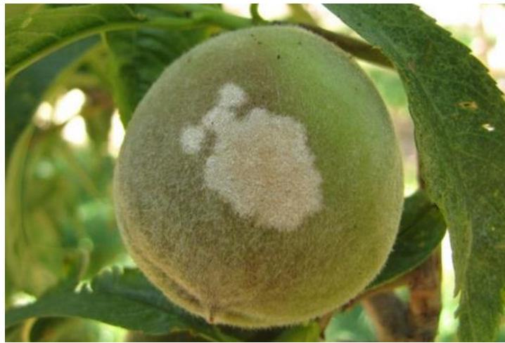
Рис. 1.4. Симптоми прояву борошнистої роси на персику [43]

Борошниста роса (збудник – Sphaerotheca pannosa Wallr.) уражує всі види кісточкових плодових культур (рис. 1.4.). На персику проявляється на всіх органах – на листках, пагонах та плодах утворюється білий борошнистий наліт, на якому пізніше з’являються клейстотеції у вигляді чорних крапочок. При ураженні пагонів спостерігається зупинка росту, деформація та відмирання верхівок. Листки, уражені борошнистою росою, грубіють, скручуються всередину відносно центральної жилки, засихають та опадають. Уражені плоди втрачають смакові якості за рахунок зниження в них цукристості, можуть загнивати [3].