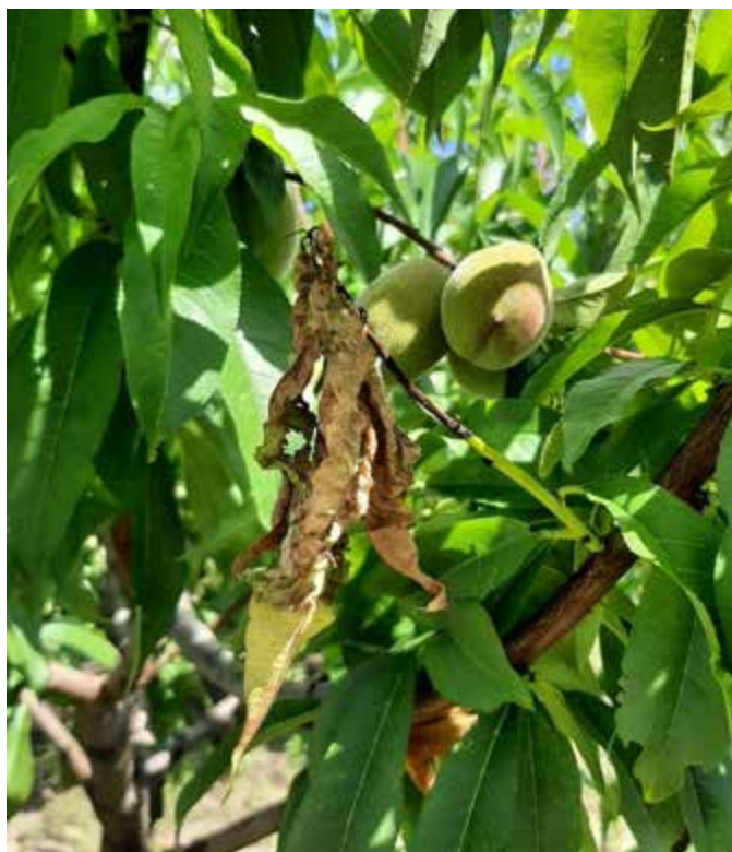
Рис. 1.6. Всихання пагонів персика внаслідок дії збудника кучерявості листків

В кінцевому випадку такі листки буріють і обпадають, плоди на деревах перестають розвиватись й засихають. Оголення уражених пагонів починається, як правило, знизу, від чого вони товстішають, викривляються, набувають жовтуватого відтінку. Частина оголених в результаті обпадання листків пагонів засихає, починаючи з верхівки (рис. 1.6.), інші гинуть при перших заморозках. Плоди, що розвиваються на уражених кучерявістю дворічних пагонах, обпадають.