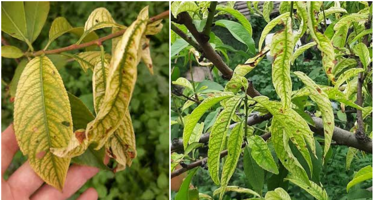
Рис. 1.2. Симптоми прояву клястероспоріозу на персику

Проявляється клястероспоріоз також на гілках, пагонах і бруньках, котрі стають блискучо-чорними і відмирають (рис. 1.2.). Квітки стають бурими, можуть засихати. На плодах можна спостерігати злегка вдавлені дрібні плями пурпурового забарвлення. Уражена тканина плодів утворює скоринку, може тріскатися з утворенням камеді [47].