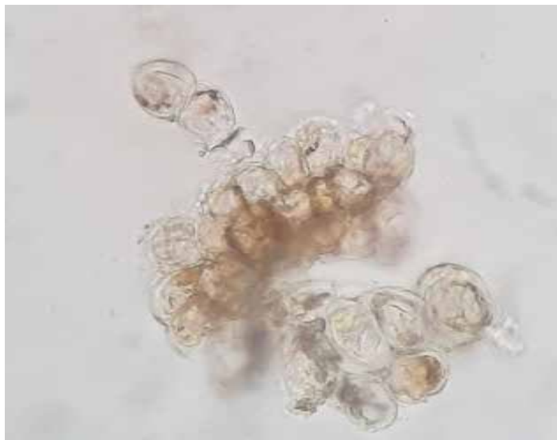
Рис. 3.4. Вихід аскоспор T. deformans із сумки (власне фото)

В основі сумок у багатьох видів наявні базальні клітини («клітини-ніжки») (рис. 3.4.). Аскоспори одноклітинні, безбарвні, гладкі, шаровидної або паличкоподібної форми. Вони проростають формуючи більш мілкі вторинні бластоспори або конідії. Бластоспори розмножуються брунькуванням та на поживних середовищах утворюють дріжжеподібні колонії рожевого або червоного кольору, схожі з деякими базидіоміцетними дріжджами.