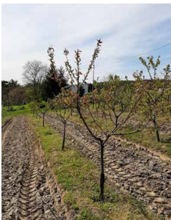
Рис. 1.9. Обрізка дерев персика 3-х річного віку

При обговоренні агротехнічних заходів у боротьбі з кучерявістю листків персика необхідно першочергово зазначити обрізування дерев. У НБС НАН України ім. М.М. Гришка було розроблене комплексне обрізування дерев персика, яке включає омолодження, регулювання плодоношення та формування крони у вигляді куща, що дуже важливо для життєздатності дерева. Декілька штаблів забезпечують довговічність дерев, у випадку підмерзання одного залишається ще стовбури, які забезпечать урожай плодів. До того ж омолоджувальне обрізування стимулює утворення нових могутніх пагонів, які надалі стануть штаблами [36].