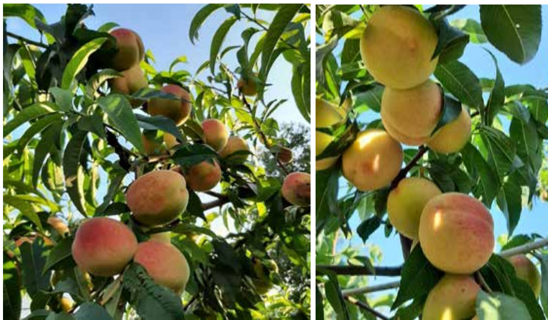
Рис. 1.8. Персик сорту Донецький білий

За показником зимостійкості незамінні сорти Київський ранній, Донецький білий (рис. 1.8.) та Грінсборо (ранньо-середньої стиглості, до 5 серпня в умовах Київщини). Щоправда, вони можуть сильно пошкоджуватися кучерявістю, тому потребують 3-4 обприскування бордоською рідиною або її замінниками.