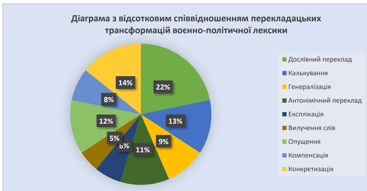
Рис. 1. Діаграма з відсотковим співвідношенням перекладацьких трансформацій воєнно-політичної лексики

Нижче наведена діаграма відомих перекладацьких трансформацій, які використовувалися під час перекладу матеріалів дослідження та їх відносне співвідношення представлена на рисунку 1.