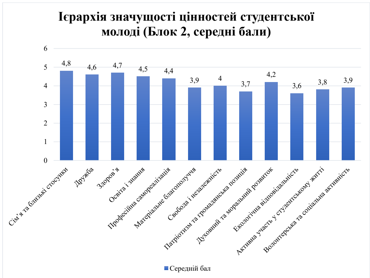
Рис. 2.1. Ієрархія значущості цінностей студентської молоді (Блок 2, середні бали)

Результати другого блоку анкетування дозволили виявити ієрархію життєвих цінностей студентської молоді та визначити ті з них, які відіграють провідну роль у структурі світоглядних орієнтацій. Найвищі оцінки отримали сім'я та близькі стосунки, що засвідчило домінування приватно-особистісних пріоритетів над професійними та соціально-громадянськими. Середній бал у 4,8 вказує на те, що для більшості студентів саме сімейні зв'язки та емоційна підтримка з боку близьких є базою для психологічної рівноваги і подальшої самореалізації. Висока значущість сім'ї як базової життєвої цінності узгоджується з психологічними теоріями, які акцентують увагу на ролі первинних соціальних інститутів у формуванні особистісних орієнтирів, і підтверджує, що навіть у період інтенсивного становлення індивідуальної автономії молодь зберігає сильну орієнтацію на міжособистісні зв'язки. Така стабільність у ставленні до сімейних цінностей свідчить про їхній