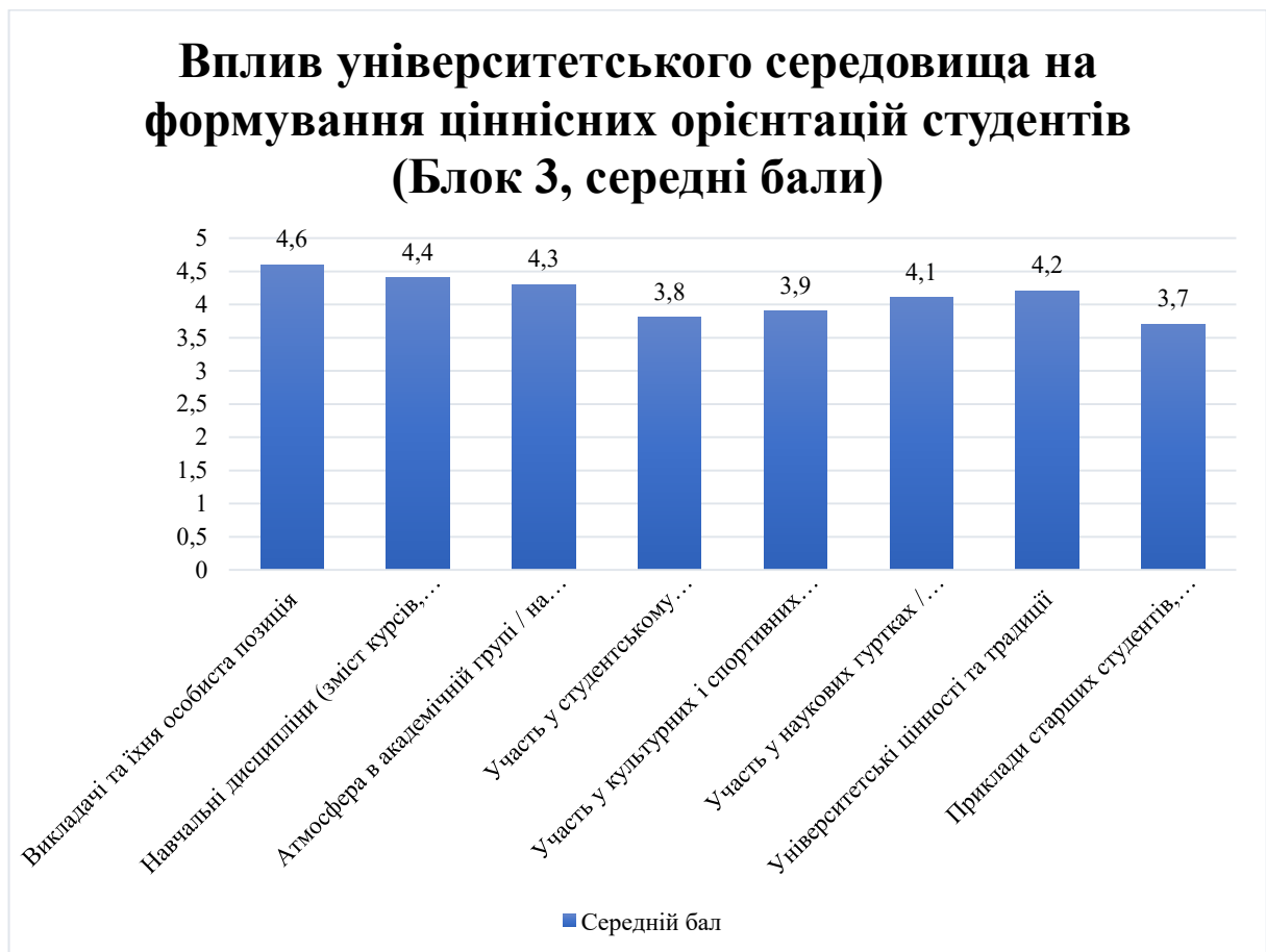
Рис. 2.2. Вплив університетського середовища на формування ціннісних орієнтацій студентів (Блок 3, середні бали)

студентської молоді. У межах цього блоку респонденти оцінювали вплив різних чинників освітнього простору за п'ятибальною шкалою, що дало можливість визначити, які саме елементи академічного життя мають найбільше значення для формування життєвих орієнтирів. Отримані результати показали багатомірність університетського середовища, яке поєднує навчальні, виховні та соціокультурні компоненти, забезпечуючи таким чином комплексний вплив на студентську молодь. Аналіз відповідей дав змогу виділити провідні фактори, серед яких особливе місце займають викладачі, навчальні дисципліни та атмосфера академічної групи. Наочне представлення результатів подано на рис. 2.2.