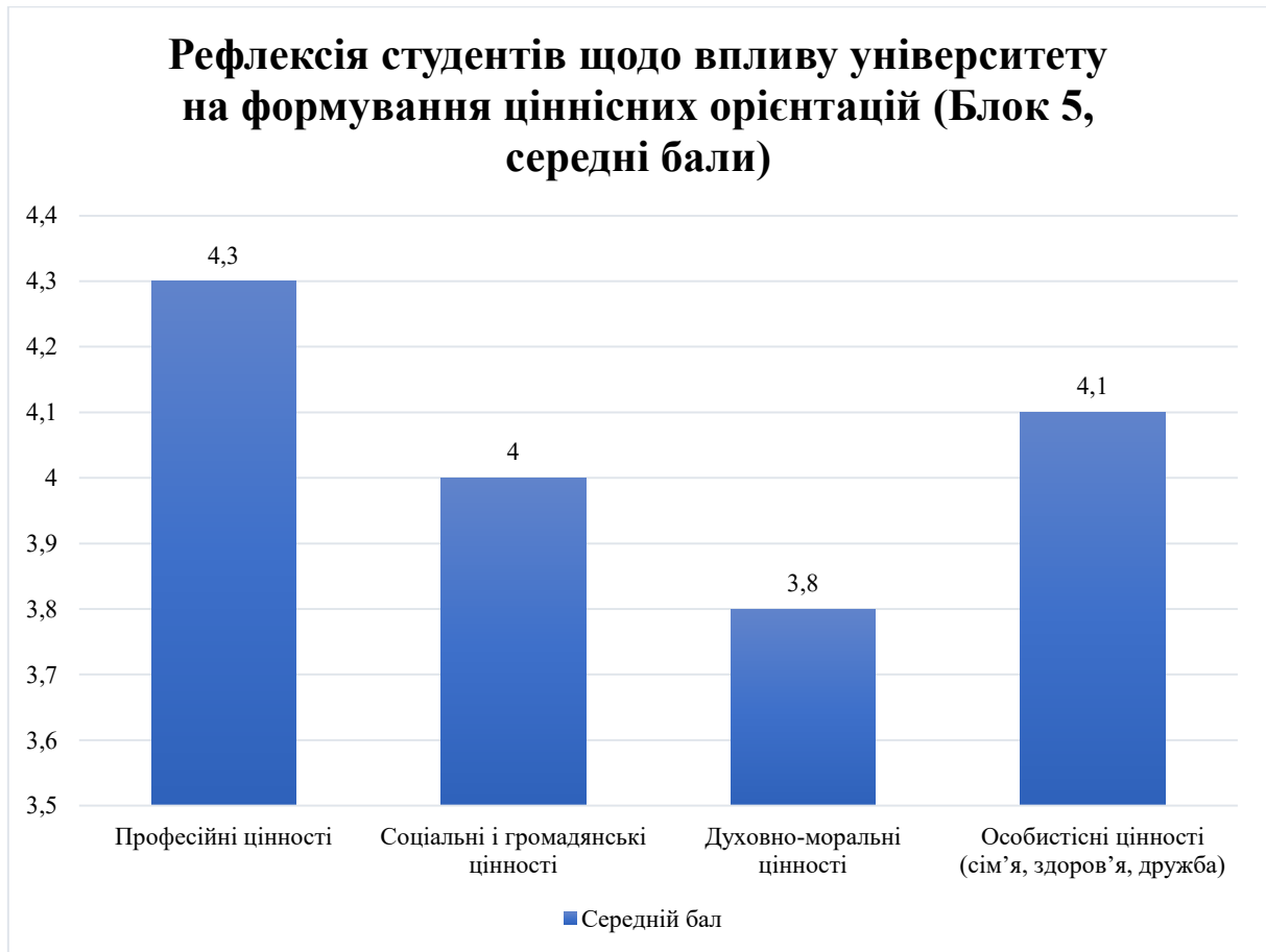
Рис. 2.3. Рефлексія студентів щодо впливу університету на формування ціннісних орієнтацій (Блок 5, середні бали)

Результати п'ятого блоку анкети засвідчили, що університетське середовище виконує багатофункціональну роль у формуванні ціннісних орієнтацій студентів. Отримані показники демонструють значний рівень впливу освітнього простору на професійні, соціальні, духовно-моральні та особистісні орієнтири молоді. Найвищі оцінки були отримані у сфері професійних цінностей, що пояснюється специфікою університету як інституції, покликаної готувати майбутніх фахівців і закладати у них усвідомлення значущості знань, навичок і професійної компетентності. Студенти визнають вирішальне значення навчальних дисциплін, досвіду викладачів та прикладів їхньої особистісної позиції, що формує не лише технічні чи теоретичні знання, а й ціннісні орієнтири, пов'язані з майбутньою професійною діяльністю. Високий відсоток респондентів, які відзначили сильний вплив університету на становлення професійних орієнтирів,