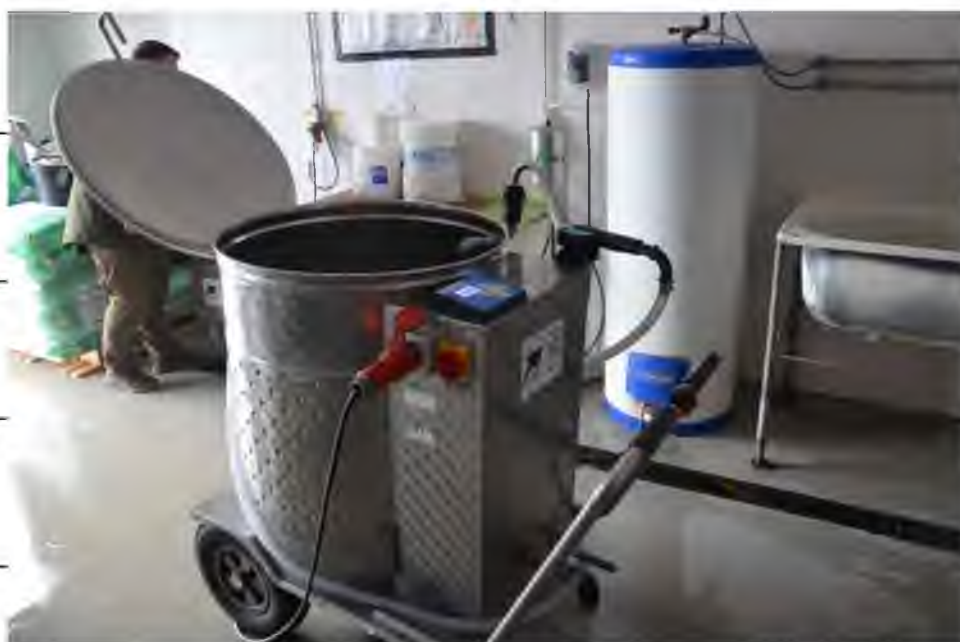
Рис.3.4. Загальний вид пересувного танку-термоса для транспортування замінника молока.

Випаювання молоком (замінником молока) здійснюється двічі на день з використанням пересувного танку-термоса (рис.3.4) в якому підтримується оптимальна температура рідини на рівні 38-39 °С.