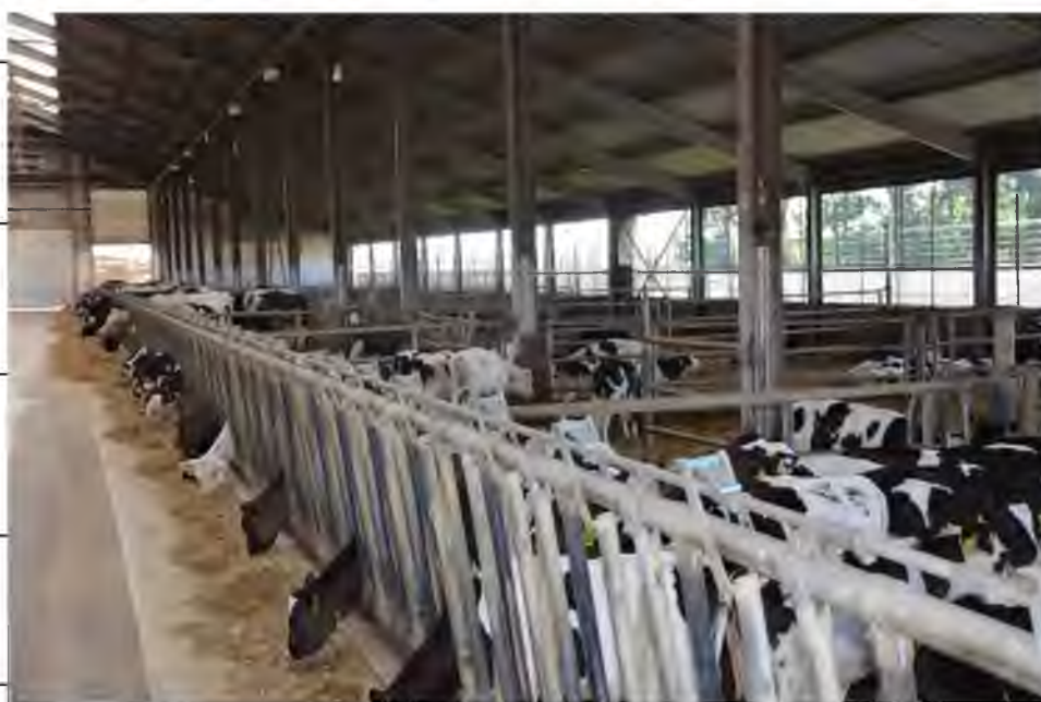
Рис.3.5. Загальний вид групових секцій для утримання телят на вирощуванні в період 3-6 та 7-12 місяців.

Утримання тварин, у віці 3-6 місяців, 7-18 місяців здійснюється в групових секціях на накопичувальній підстилці, з використанням FMR характеристика яких представлена в табл. 3,1-3,2.