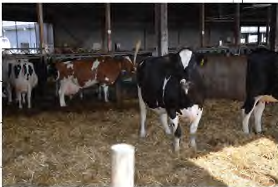
Рис.3.1. Утримання корів раннього та пізнього сухостою на накопичувальній підстилці.

Сухостійних корів, в умовах ПСП „Україна” утримують на накопичувальній підстилці (рис.3.1.), з розподілом на дві підгрупи: 1) ранній сухостій (до 35-40 днів до отелення); 2) пізній сухостій (25-20 днів до отелення). Склад раціону корів першої групи- 9,3 кг силосу кукурудзяного, 5,8 кг ячмінної соломи, 5 кг люцернового сінажу, 3,71 кг комбікорму. У фізичній вазі раціон важить 28,81 кг з вмістом 14,10 кг сухої речовини корму. Пізньому сухостою згодують 31,33 кг корму (в перерахунку-14,10 кг сухої речовини корму), з зменшенням даванки ячмінної соломи до 4,7 кг, та збільшенням комбікорму до 5,13 кг.