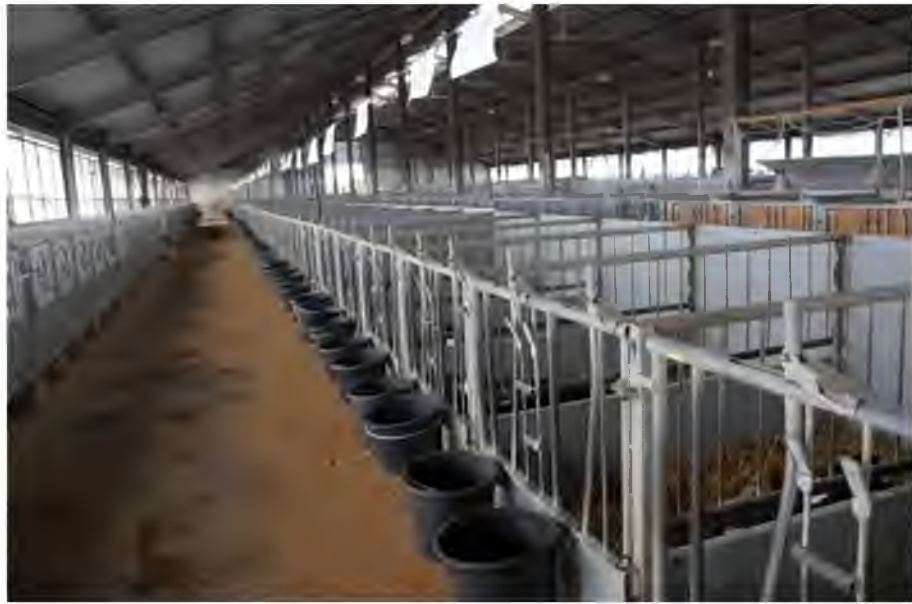
Рис.3.2. Загальний вид приміщення для утримання телят в індивідуальних вольерах