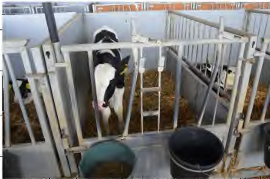
Рис.3.3. Загальний вид індивідуального вольера для утримання телят (на передньому плані відра для розміщення стартового гранульованого комбікорму та замітника молока)