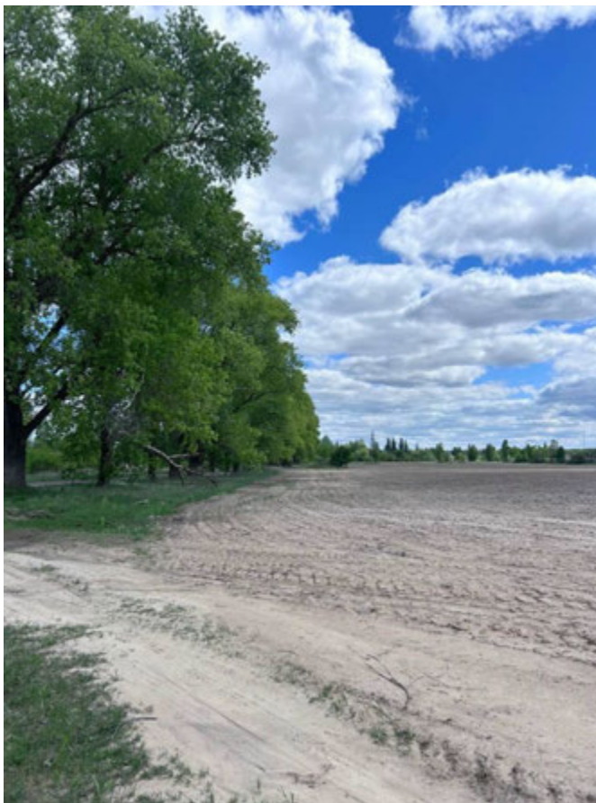
Рис. 4.2. Тимчасова пробна площа № 2