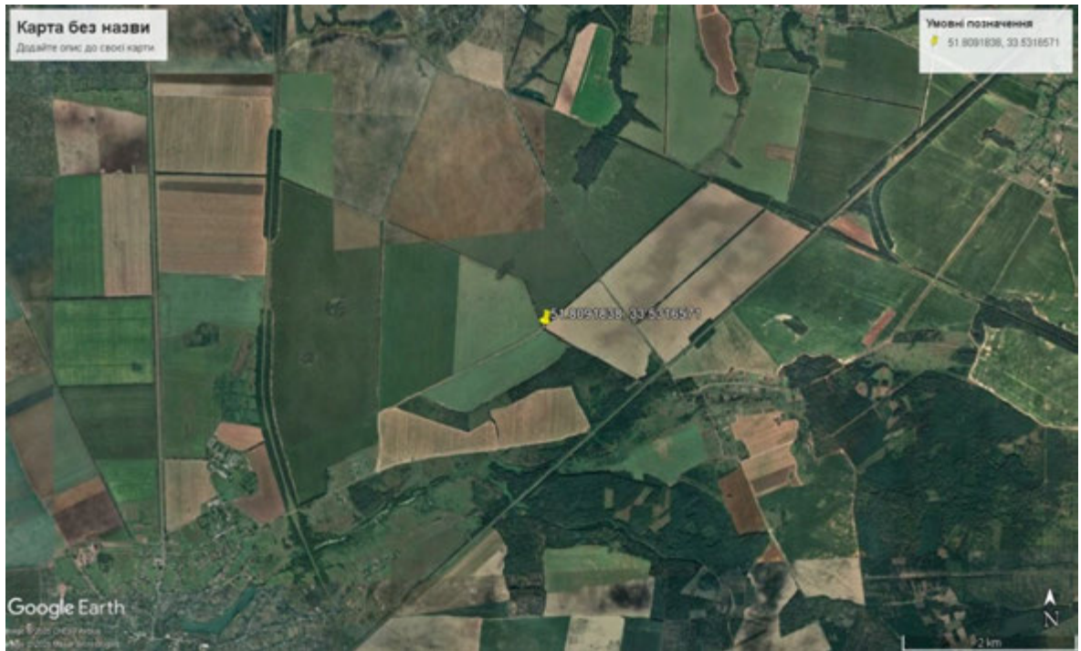
Рис. 2.1. Розміщення проаналізованих полезахисних смуг

Під час опрацювання програмних питань бакалаврської роботи були виконані наступні роботи: