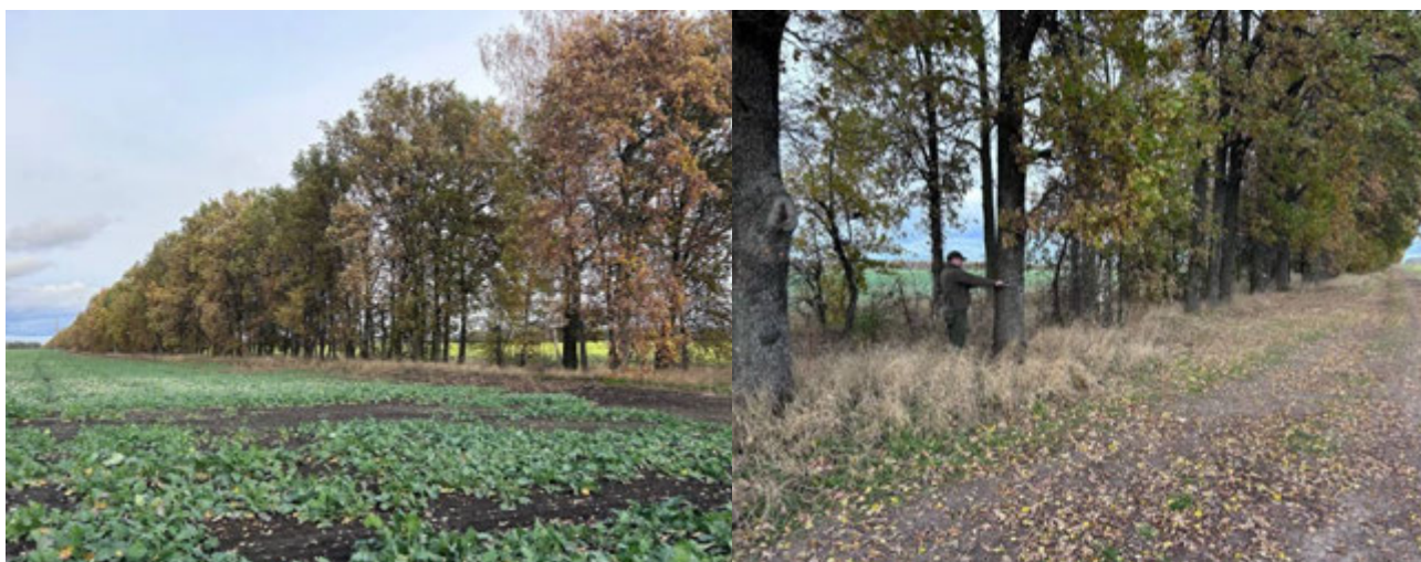
Рис. 4.1. Тимчасова пробна площа № 1