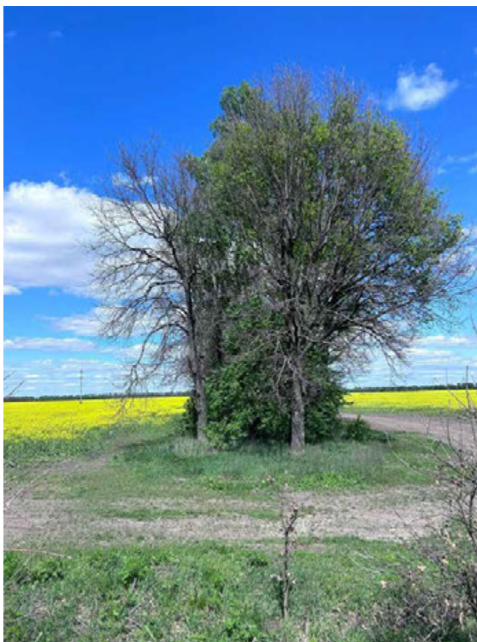
Рис. 4.3. Тимчасова пробна площа № 3

рядами та одним міжряддям становить 5,0 м, за проекцією крон – 8,0 м. Середній діаметр становить 37,3 см, середня висота 18,9 м, бонітет II. Лісова смуга щільної конструкції, що вказує на відсутність проведення рубок догляду щодо підтримання продувної конструкції. Основні таксаційні показники полезахисної лісової смуги розраховані в дод. А (табл. А.3, рис. А.3) та приведено в табл. 4.3.