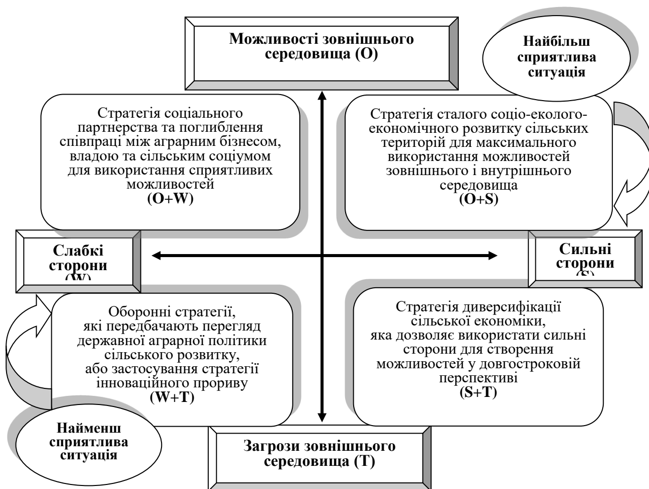
Рис. 3. Стратегічні альтернативи розвитку сільських територій Західного Полісся України*

SWOT -аналізу виявлено взаємозв'язок зовнішніх і внутрішніх чинників розвитку сільських територій, а також оцінено існуючі загрози та потенційні можливості у сфері сільської економіки не лише для територій Західного Полісся, а й держави в цілому (рис. 3).