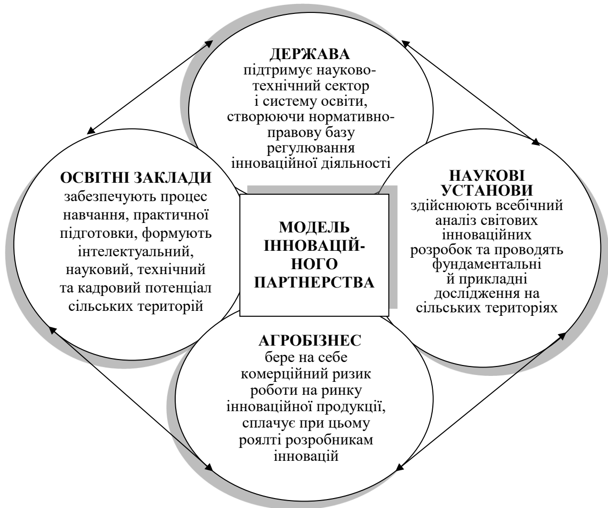
Рис. 5. Функціональні взаємозв'язки та взаємодія учасників інноваційного партнерства на сільських територіях *

наукових знань і здійснення наукових процесів та сформувати єдину базу аграрних наукових розробок. Вибір інноваційних проектів доцільно здійснювати залежно від рівня їх відповідності стратегічним та операційним цілям розвитку окремих сільських територій.