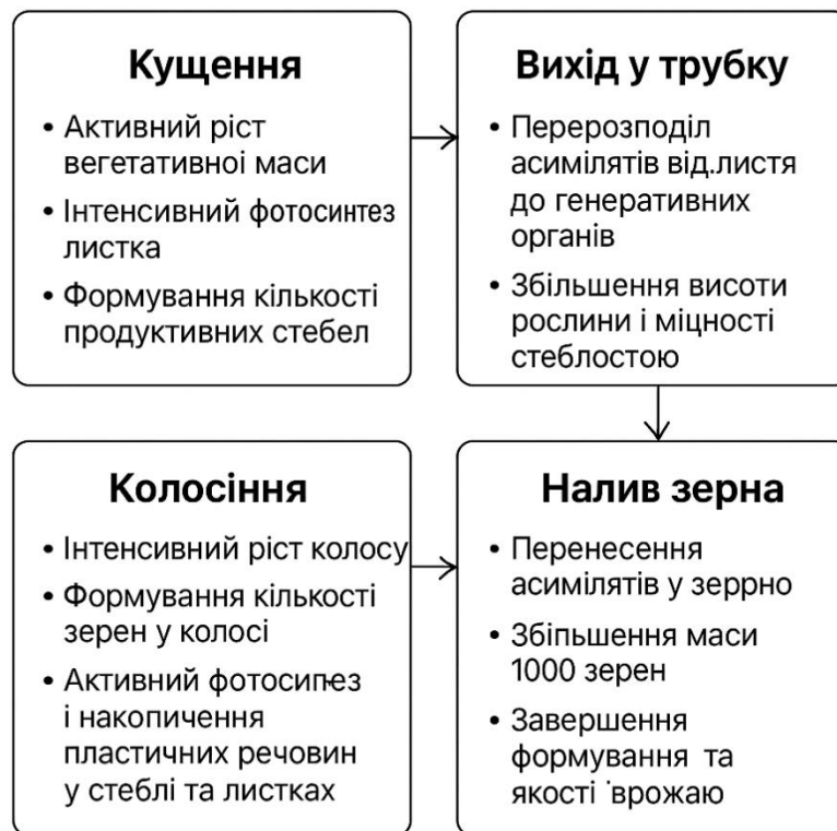
Рис. 3.1. Схема взаємозв'язку фенофаз, фотосинтезу та формування врожаю озимої пшениці