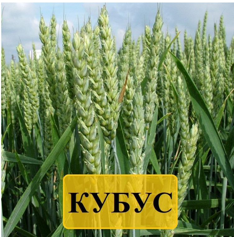
Рис. 1.6 – сорт «Кубус» пшениці м'якої озимої середньостиглої

він був зареєстрований у Реєстрі сортів у 2009 році. Цей сорт пшениці – є справжнім рекордсменом: середньостигла, середньоросла, має високий рівень кущентності, що дозволяє використовувати нижчі норми висіву (Кубус, пшениця, KWS)