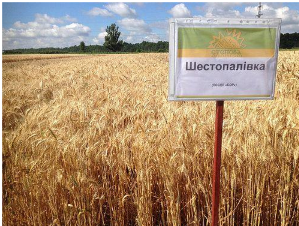
Рис. 1.5. Сорт пшениці м'якої озимої «Шестопалівка»

Пшениця озима «Шестопалівка» – увисоковрожайний, ранньостиглий, універсальний сорт озимої пшениці, виведений українськими селекціонерами , який є стійкий до посухи, заморозків, хвороб, вилягання та висипання зерна з колоса. Завдяки високому вмісту білка та клейковини має відмінні борошномельні та хлібопекарські показники . Сорт є дворучкою, добре адаптується до різних умов вирощування в усіх регіонах України. [1, 8]