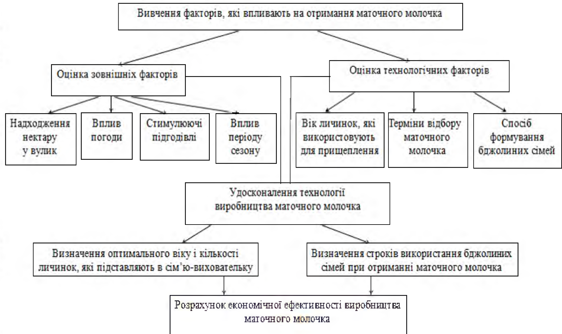
Рис. 2.1. Загальна схема проведення досліджень