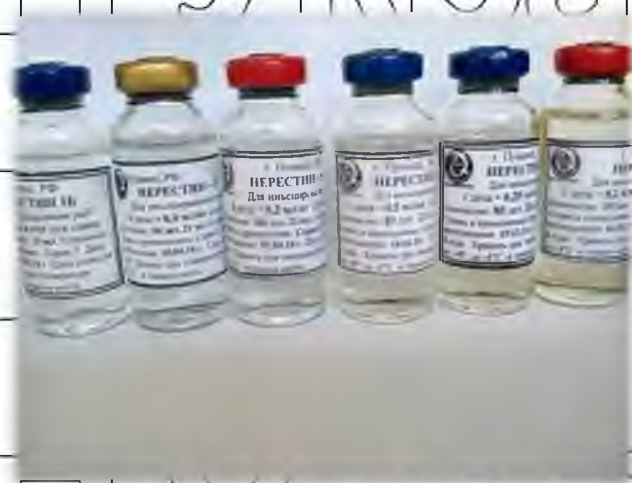
Рисунок 1.3. Препарати серії Нерестин

На рис. 1.3. показано різновиди препаратів серії Нерестин: