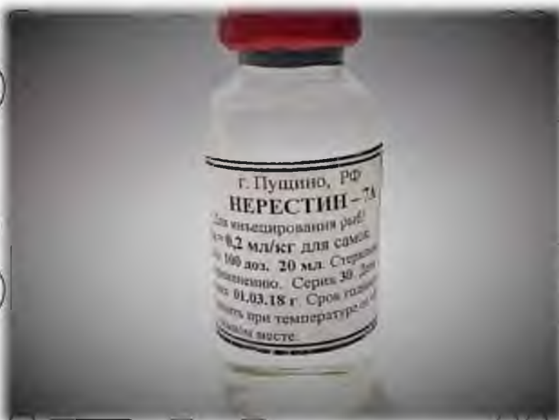
Рисунок 1.1. Ампула препарату Нерестин – 7А [25]

Принцип дії Нерестину та аналогічних йому фірмових препаратів, які вже широко застосовуються у світовій практиці (Оваприм, Овапель, LHRH, Оватид та інші), а також його відмінність від дії готових гіпофізарних гонадотропних гормонів наведені на схемі (рис. 1.2).