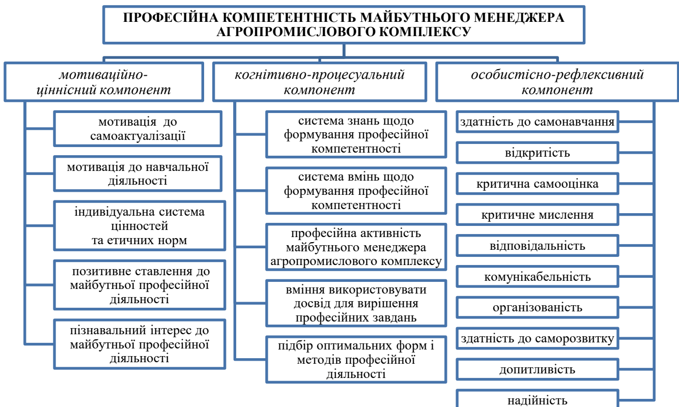
Рис. 1. Структурна схема професійної компетентності майбутнього менеджера агропромислового комплексу

Для ефективного управління підприємством у нинішніх умовах менеджер агропромислового комплексу має володіти такими характеристиками та якостями: стратегічне, інноваційне мислення; застосування сучасних методів і технологій в процесі управління підприємством; здатність вирішувати нестандартні проблеми та брати на себе відповідальність за прийняті рішення; вміння працювати в команді, підтримувати сприятливу для роботи атмосферу, вміння навчати підлеглих та колег. Все це вимагає побудови структури професійної компетентності менеджерів агропромислового комплексу (рис. 1) й нової організації навчального процесу.