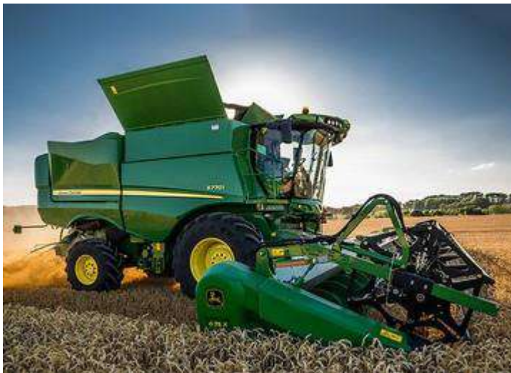
Рис 2.2. Комбайн John Deere s 770.

Облік врожаю проводили суцільним збиранням комбайном Комбайн John Deere s 770.