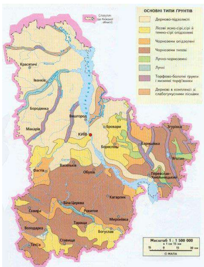
Рис 2.1. Карта ґрунтів Київської області.

Площа сільськогосподарських угідь становить 1304,6 га. Підприємство має в розпорядженні склади, майстерні , гараж, тваринницькі приміщення, дороги з твердим покриттям і інші необхідні для господарювання споруди.