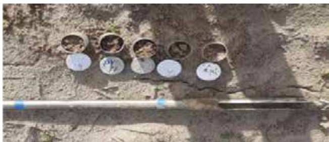
Рис 3.1 Відбір зразків на вологість ґрунту.

Дослідження проводяться ТОВ «ім. Шевченка» в селі Лаврики Сквирського району Київської області.