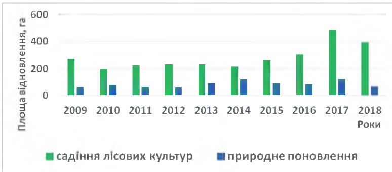
Рис. 1. Динаміка обсягів природного лісовідновлення і садіння лісових культур в ДП «Баранівське ЛМГ»

У лісокультурному фонді останнього десятиріччя ділянки з суборовими умовами займають 72 %, а частка культур сосни сягає більше 60%. Частка природне поновлення сосни звичайною у загальних обсягах лісовідновлення незначна (35 га за 10 р.) і становить усього 4,1%.