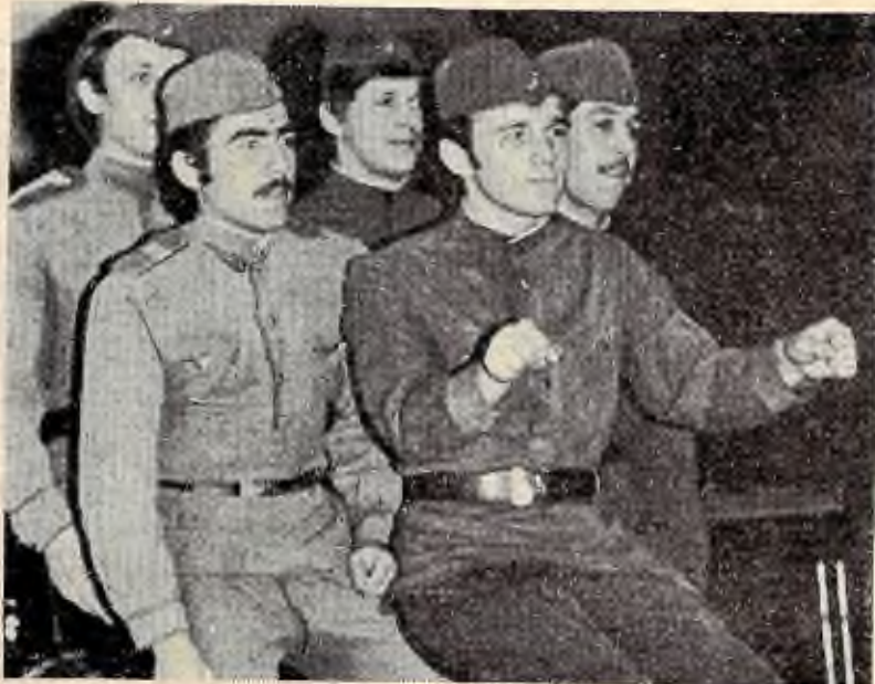
Навічно в пам'яті народній закарбувався подвиг Солдата Великої Вітчизняної.