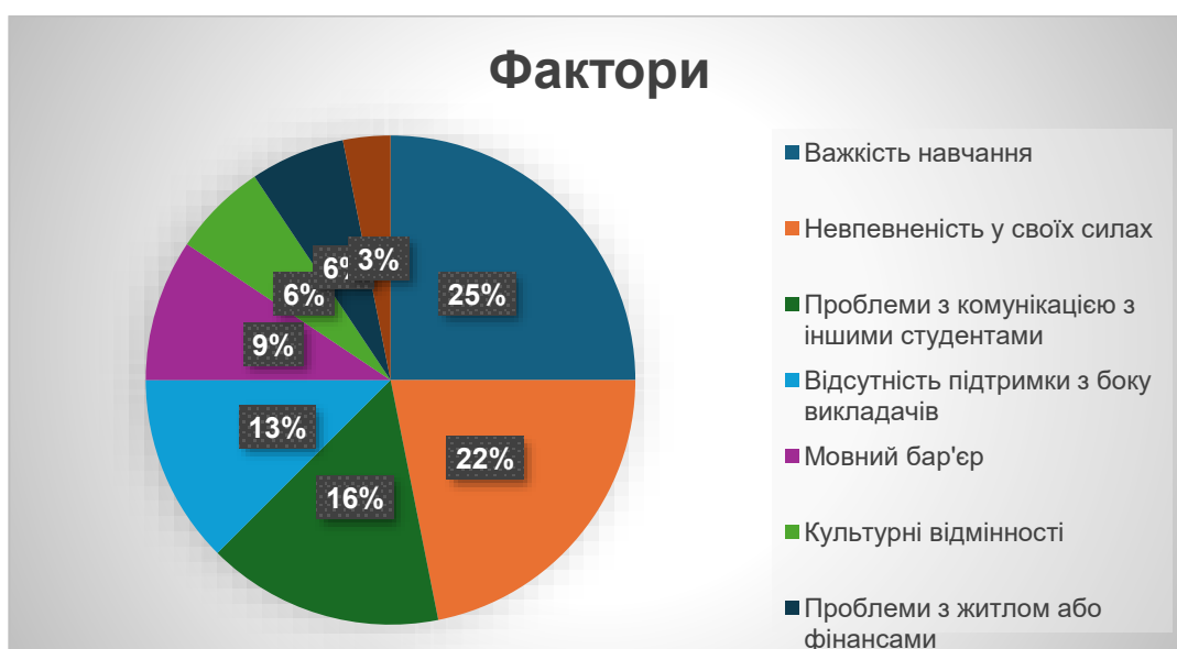
Рис 3.4 Фактори, що впливають на процес адаптації

Для кращого розуміння, які саме фактори найбільше впливають на процес адаптації студентів, було запропоновано питання, у якому студенти могли вибрати всі фактори, що стосуються їхнього досвіду. Це питання дозволяє виявити найпоширеніші перешкоди та визначити, на які аспекти потрібно звернути увагу для полегшення адаптаційного процесу [25, с. 104].