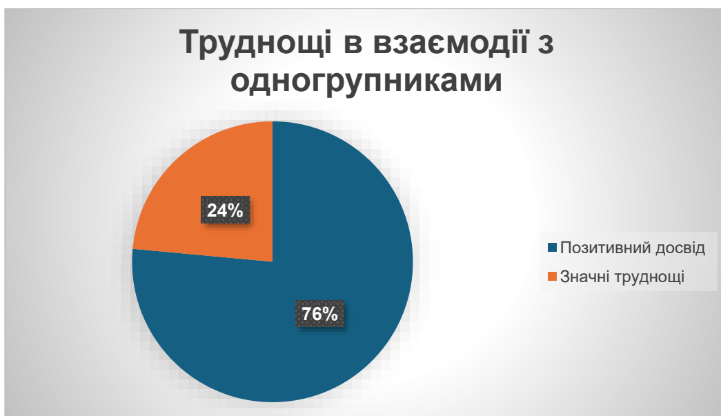
Рис 3.3 Труднощі в взаємодії з одногрупниками

Більшість студентів (76%) мають позитивний досвід взаємодії з одногрупниками (оцінки 1 та 2), однак 24% студентів відчують значні труднощі у взаємодії.