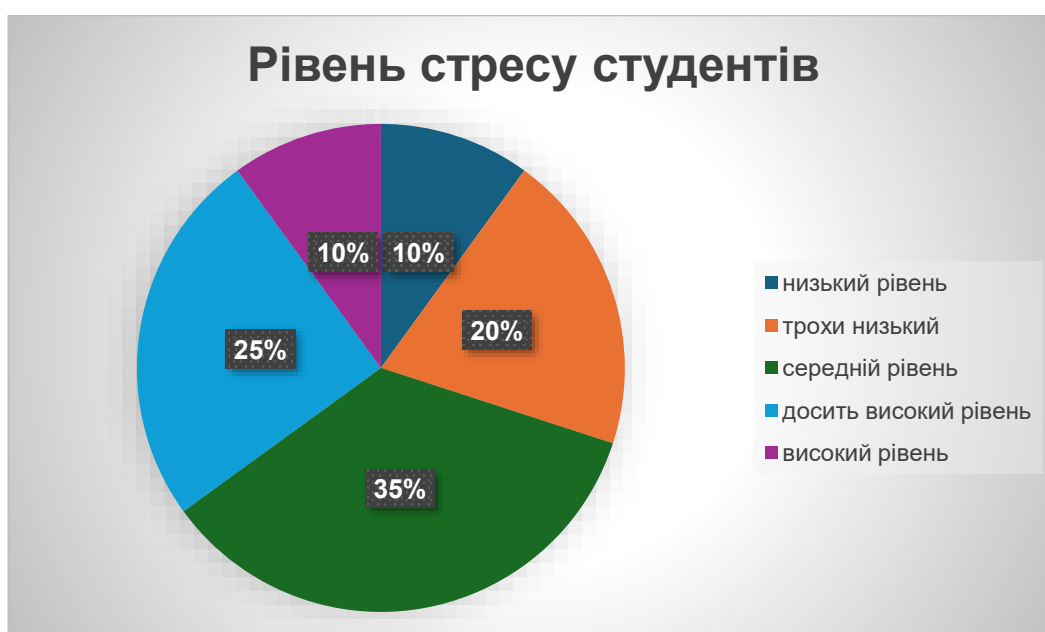
Рис. 3.1 Рівень стресу студентів

Для того, щоб краще зрозуміти, як студенти оцінюють свій рівень стресу, було проведено анкетування, в якому студенти мали змогу оцінити свій рівень стресу за останній місяць за шкалою від 1 до 5, де 1 – низький рівень стресу, а 5 – високий рівень стресу. Цей підхід дозволяє виявити не тільки загальну тенденцію, але й рівень стресу у різних групах студентів, що може допомогти в розробці ефективних стратегій для підтримки їхньої адаптації та благополуччя.