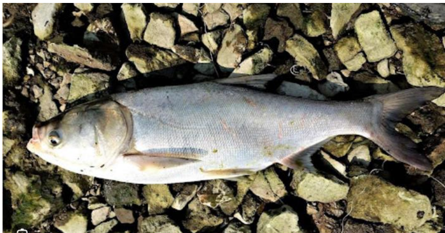
Рис 1.3 Білий товстолюб ( Hypophthalmichthys molitrix )

південних регіонах України та у водоймах-охолоджувачах — до 20 кг. Середньорічний приріст цієї риби становить до 2 кг. Відрізняється великою головою та низько посадженими очима. Тіло білого товстолоба вкрите дрібною лускою, його спина має сірувато-зелений колір, а боки сріблясті, без плям[1].