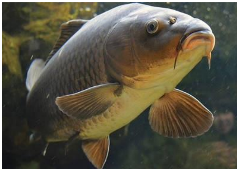
Рис 1.1 Короп ( Cyprinus carpio )

Лускатий короп має тулуб, повністю вкритий однорідною лускою, розташованою рядами від голови до хвостового плавця. Дзеркальний або малолускатий короп має більшу за розміром і блискучу луску, що нагадує дзеркальце. У голих коропів кілька лусок можуть бути присутні біля спинного, хвостового або анального плавців.