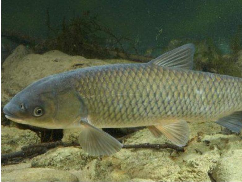
Рис 1.2 Білий амур ( Stenopharyngodon idella )

допомогою потужних глоткових зубів, розташованих на нижньощелепних кістках[4].