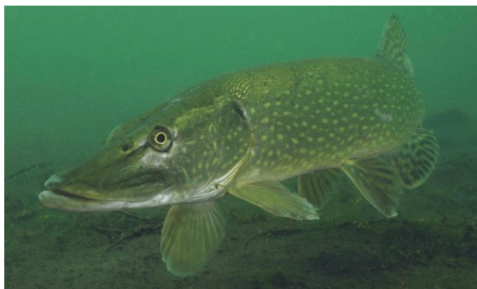
Рис 1.6 Щука ( Esox )

Щука ( Esox ) широко поширена в озерах, річках та водосховищах України й є великою, швидкозростаючою рибою, що становить перспективний об'єкт аквакультури.