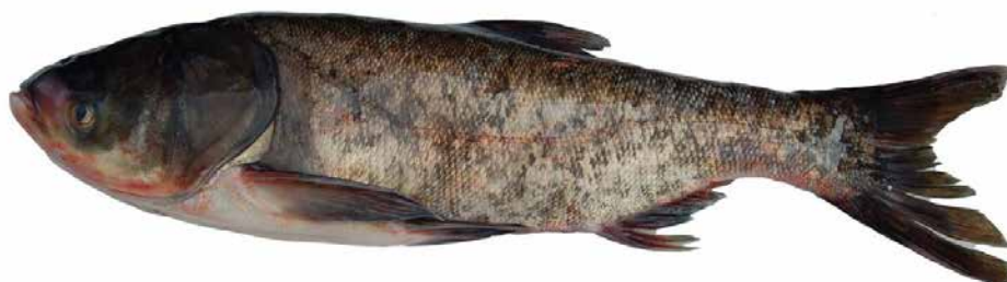
Рис 1.4 Строкатий товстолоб ( Aristichthys nobilis )

Строкатий товстолоб ( Aristichthys nobilis ) є рибою, яка відзначається найвищою інтенсивністю росту серед рослиноїдних видів і є найбільш теплолюбною. У водоймах Китаю та південних регіонах України він може досягати маси 35-40 кг. У водоймах-охолоджувачах України річний приріст цієї риби становить 5-6 кг. Строкатий товстолоб має велику голову і низько посаджені очі, а його тіло, вкрито дрібною лускою, є більш високим порівняно з білим товстолобом.