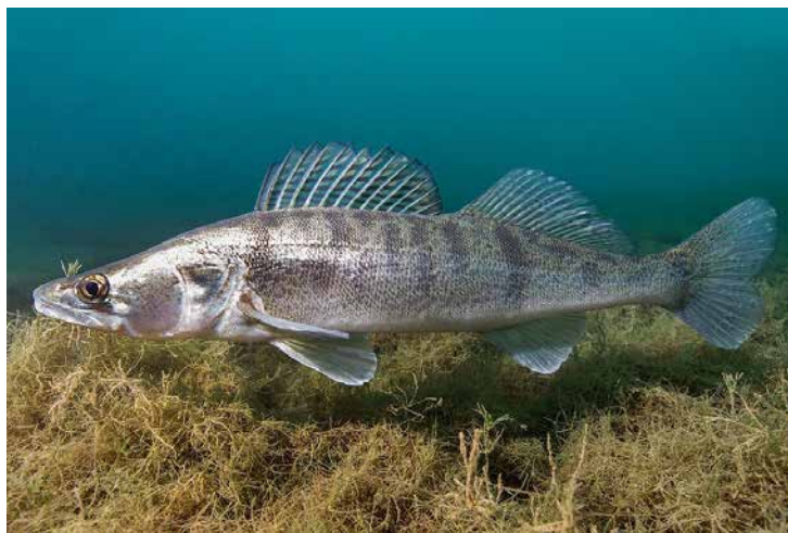
Рис 1.5 Судак ( Sander lucioperca )

Судак ( Sander lucioperca ) — зграйна хижа риба з родини окуневих, поширена у водоймах Європи, а також у басейнах Балтійського, Чорного та Азовського морів. У природі харчується дрібною рибою, такою як плотва, піскар, уклейка, бичок і йорж.