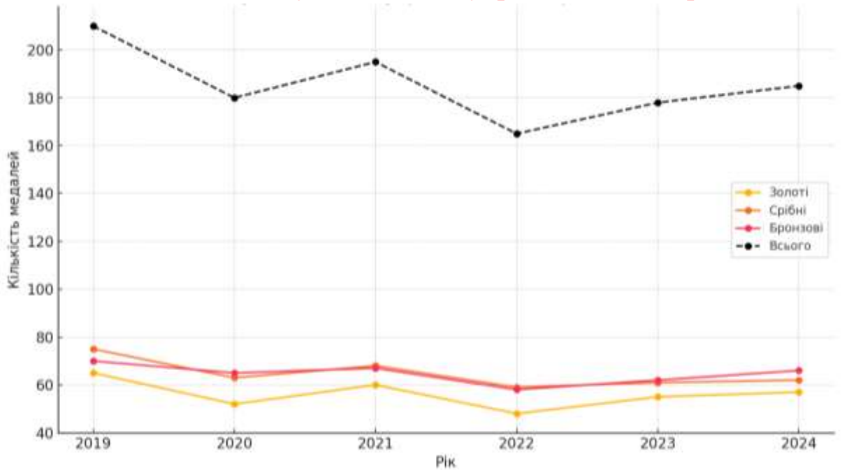
Рис. 2.1. Динаміка здобуття медалей українськими спортсменами