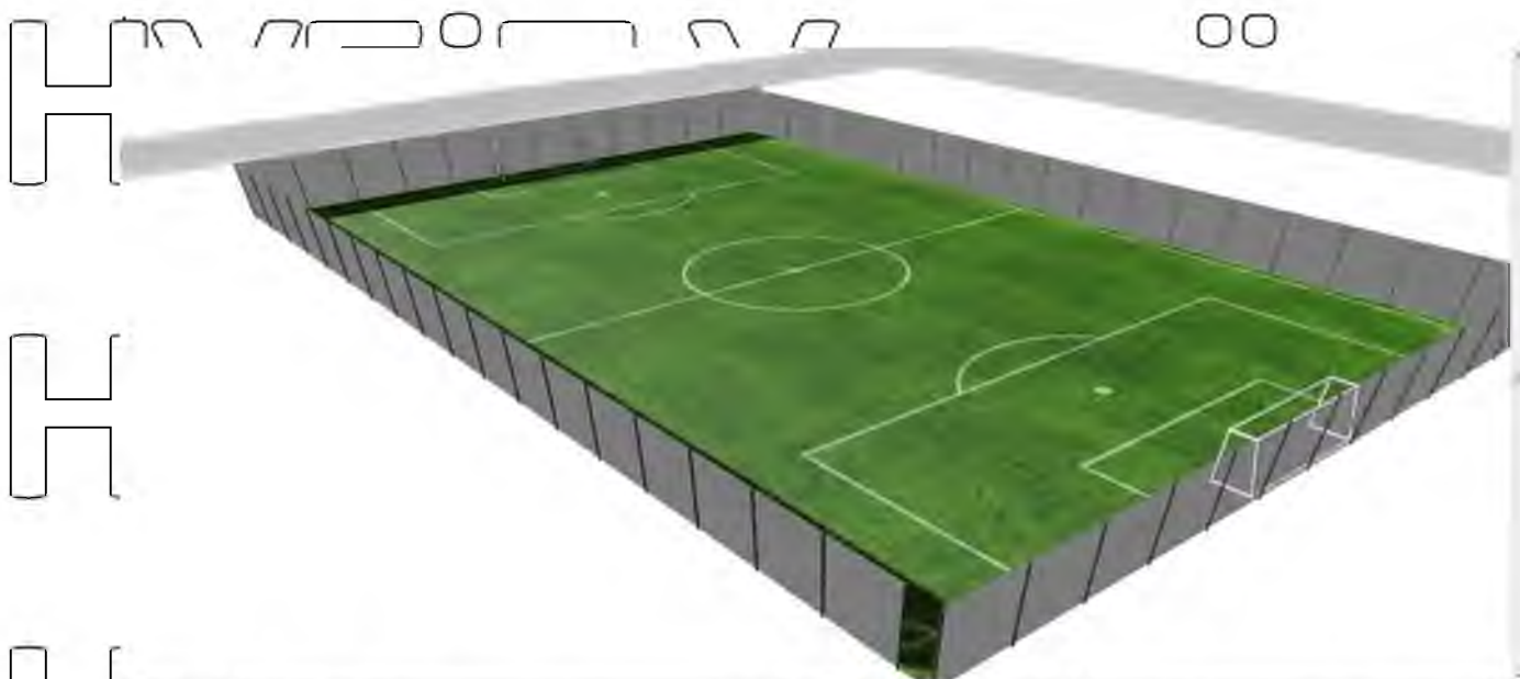
Рис. 2.1. Макет футбольного поле ДЮСШ «Юніор»

Перелік витрат на облаштування волейбольного та баскетбольного майданчика представлено в таблиці 2.7. вигляд майданчика розраджено на рис. 2.2.