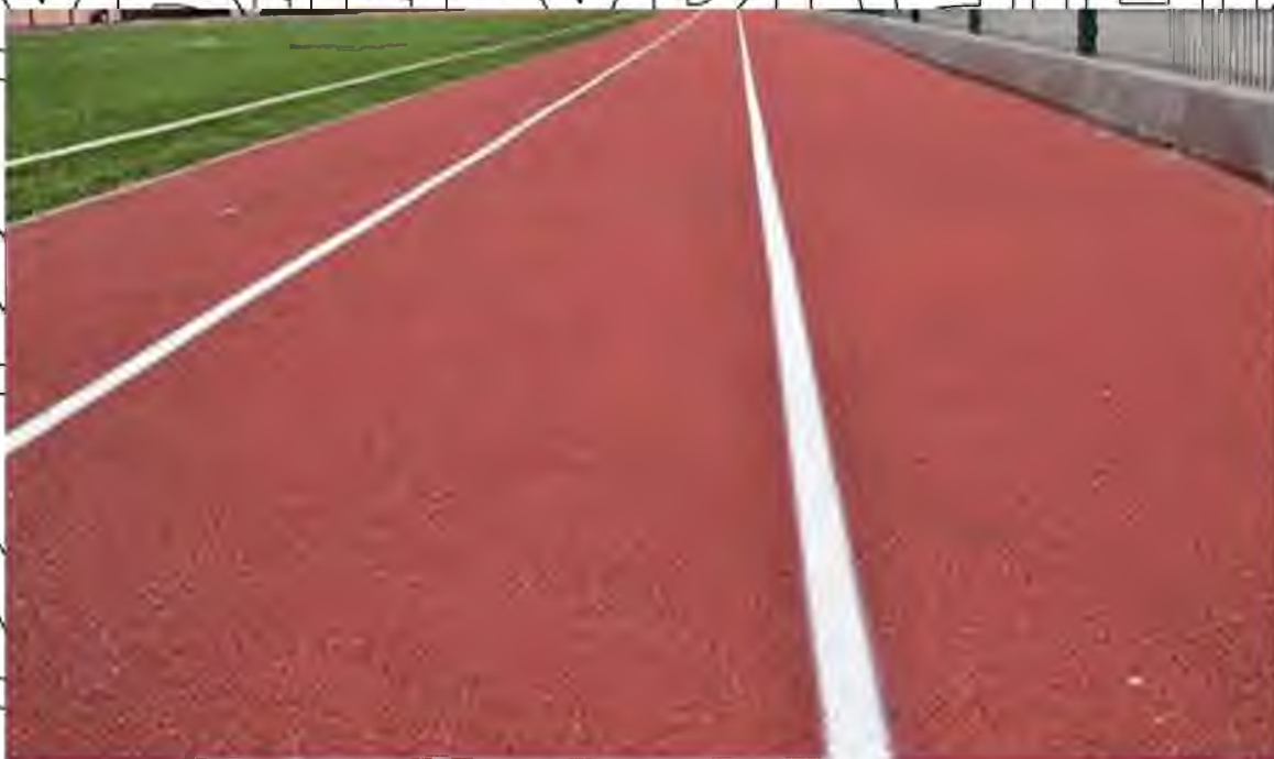
Рис. 2.4. Макет бігової доріжки ДЮСШ «Юніор»

із способів розігріву є пробіжка. Тому у будь-якій спортивній школі має бути обладнана бігова доріжка (рис 2.4).