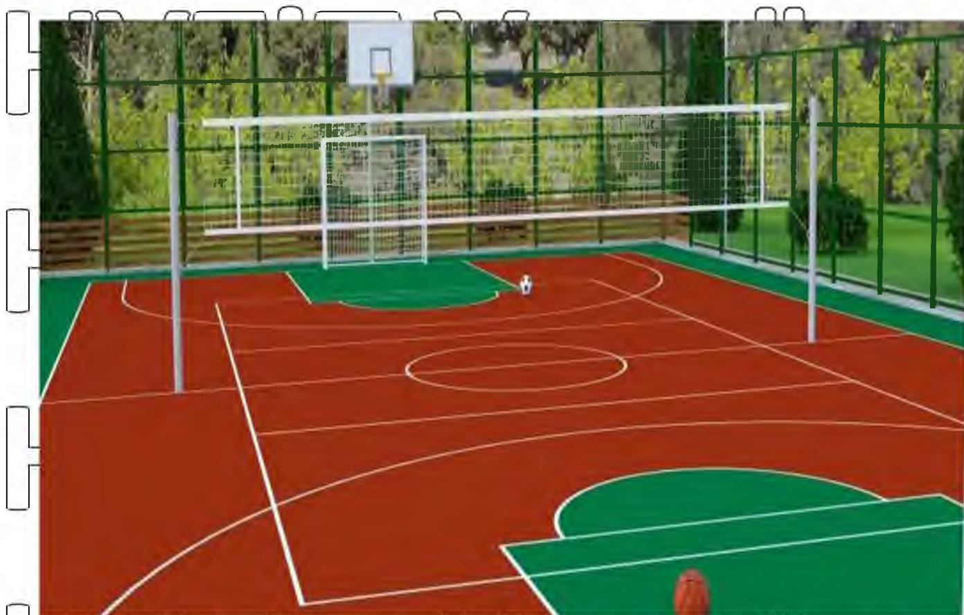
Рис. 2.2. Макет волейбольного та баскетбольного майданчика ДЮСШ «Юніор»

Для того, щоб діти могли прокачати м'язи та покращити свій фізичний стан планується обладнати атлетично-тренажерний майданчик. Його вигляд представлено на рис. 2.3.