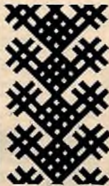
Прийшла до нас зима...