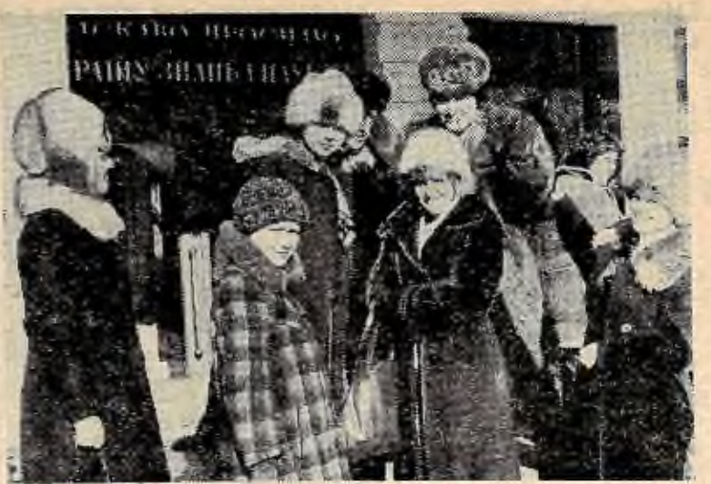
Агітбригада «Дружба» нашої академії в гостях у школярів села Згурівки.