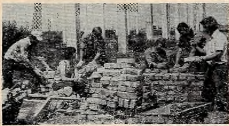
Цього літа на славу попрацювали будзагонівці УСГА. На знімку: на будівництві агрохімічного комплексу учоспу «Великосітнінський» студенти II курсу агрофаку.