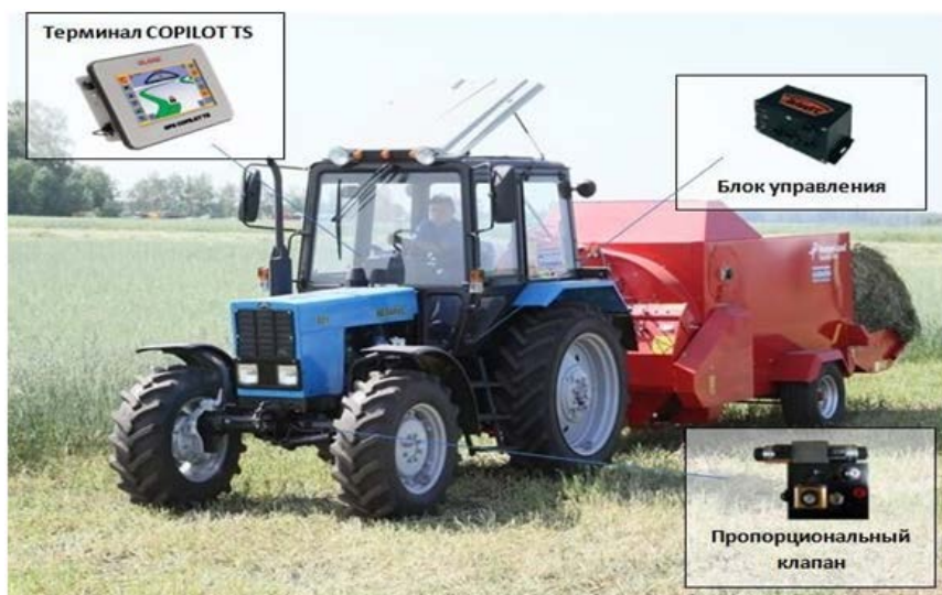
Рис. 1. Застосування геоінформаційних систем та комп'ютерних засобів супутникового моніторингу у технології точного землеробства.

VRA Seeding (спецтехнологія висіву насіння зі змінною швидкістю).