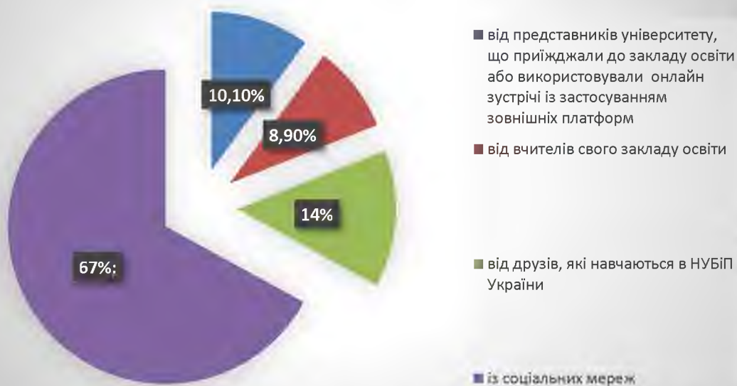
Рис. 3.1. Результати відповідей на запитання «Джерела отримання інформації про НУБіП України»