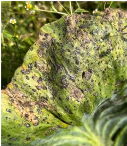
Рис. 3.2. Сильне ураження листків капусти альтернаріозом

На листках спостерігаються темно-коричневі до чорних плями, які мають концентричну (кільцеву) структуру, характерну для чорної плямистості. Плями сухі, з ознаками некрозу, краї знебарвлені або жовтуваті. Часто видно дрібні чорні крапки, які є спороносними структурами гриба (конідії). Тканина листка втрачає тургор, стає ламкою, іноді з отворами (рис. 3.2).