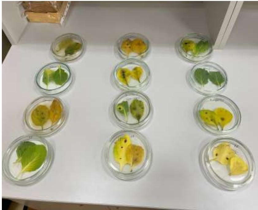
Рис. 3.5. Інокульовані суспензією конідій патогену, листки капусти

На 7 день після постановки досліду та спостереження, результати занесено до таблиці (таблиця 3.3), де оцінили візуальну інтенсивність ураження рослин. Зміни проявлялися у вигляді жовтизни, некротичних плям та зменшення зеленого асиміляційного поля листка.