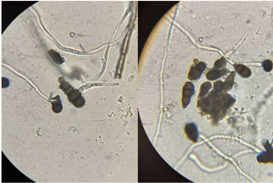
Рис. 3.3. Збудник хвороби гриб A. brassicicola

Alternaria alternata - часто виступає вторинним патогеном після дії основного збудника. Конідії темно-оливкові, довгі, багатоклітинні.