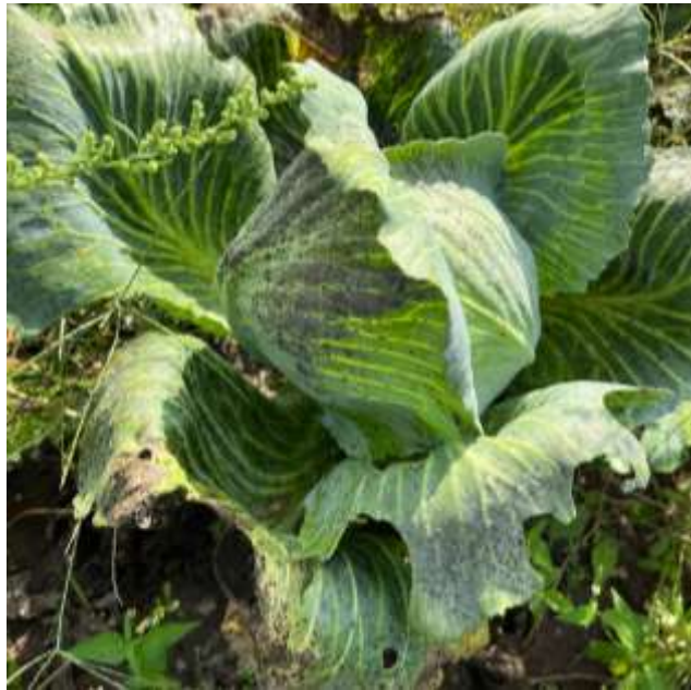
Рис. 3.1. Прояв альтернаріозу на капусті

На листках спостерігаються темно-коричневі до чорних плями, які мають концентричну (кільцеву) структуру, характерну для чорної плямистості. Плями сухі, з ознаками некрозу, краї знебарвлені або жовтуваті. Часто видно дрібні чорні крапки, які є спороносними структурами гриба (конідії). Тканина листка втрачає тургор, стає ламкою, іноді з отворами (рис. 3.2).