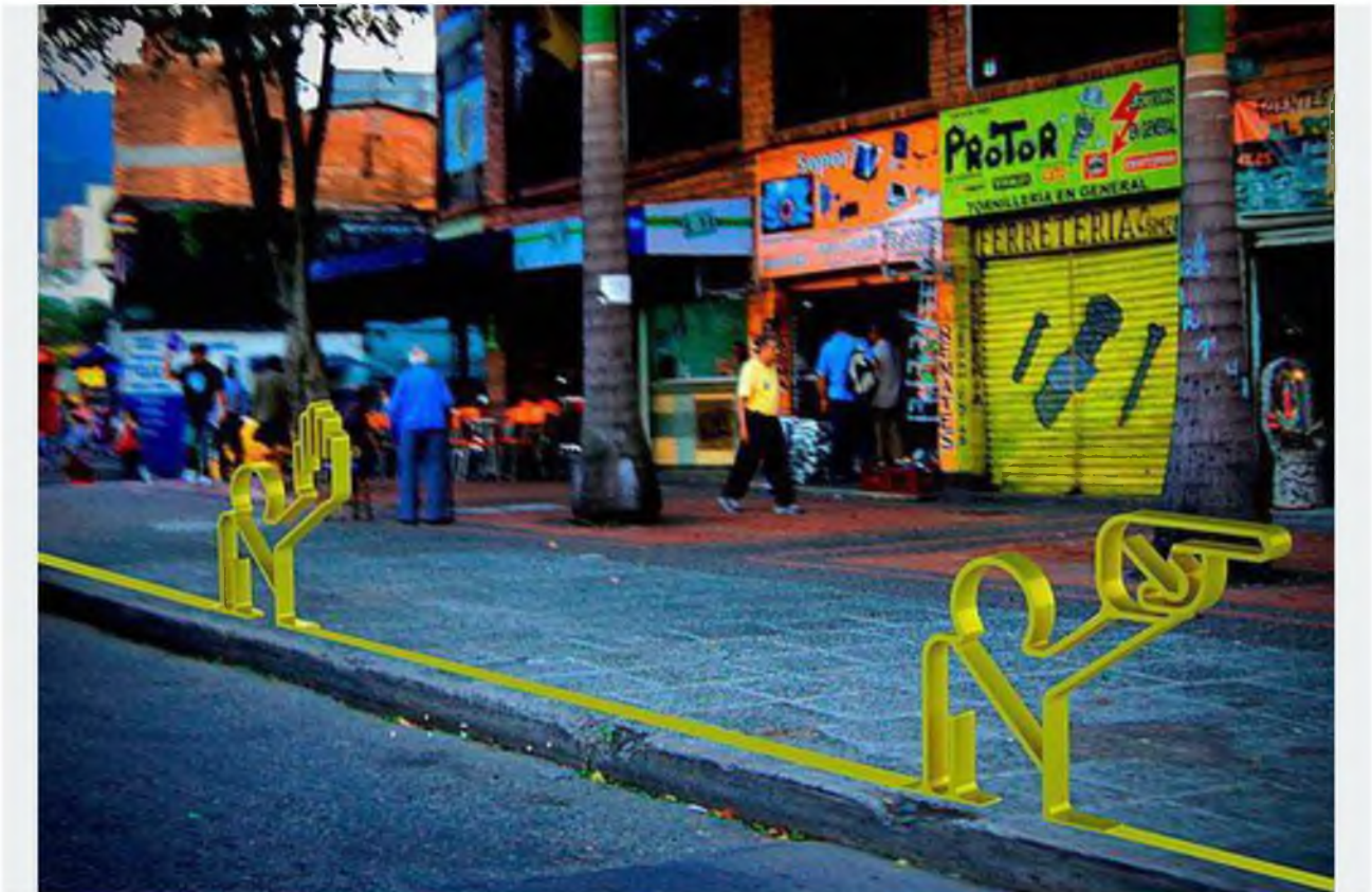
Стенди Don Luis для підвищення безпеки переходу проїжджої частини вулиці

На жаль, не всі пішоходи при переході вулиці користуються "зеброю". І на жаль, не всі автомобілісти при русі ту саму "зебру" помічають. Тому щороку по всьому світі калічаться і навіть гине велика кількість людей на дорогах. Ось для того, щоб з цим якимось боротися, і створено ось такий оригінальний стенд-чоловічок Don Luis, який навчить людей користуватися вуличною розміткою і помічати її. Компанія Країна стендів пропонує широкий асортимент сучасних красивих стендів для дошкільних закладів шкіл, інших навчальних закладів, державних установ, підприємств, військових частин, спортивних секцій.