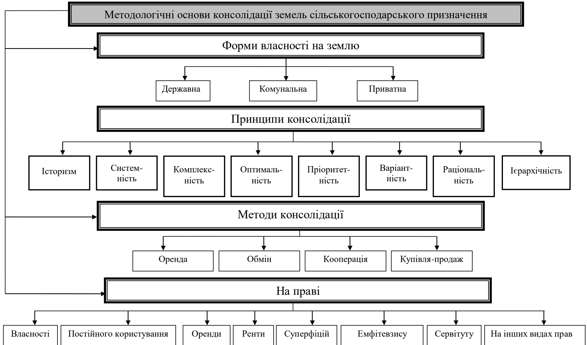
Рис. 1. Логічно-смыслова модель методології консолідації земель сільськогосподарського призначення Примітка. Розроблено автором