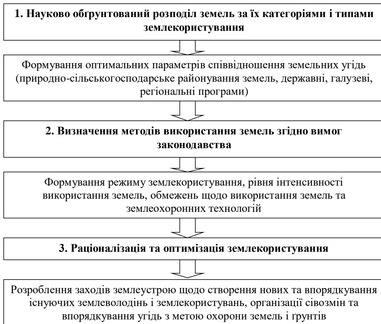
Рис. 3. Етапи консолідації сільськогосподарських земель шляхом землеустрою