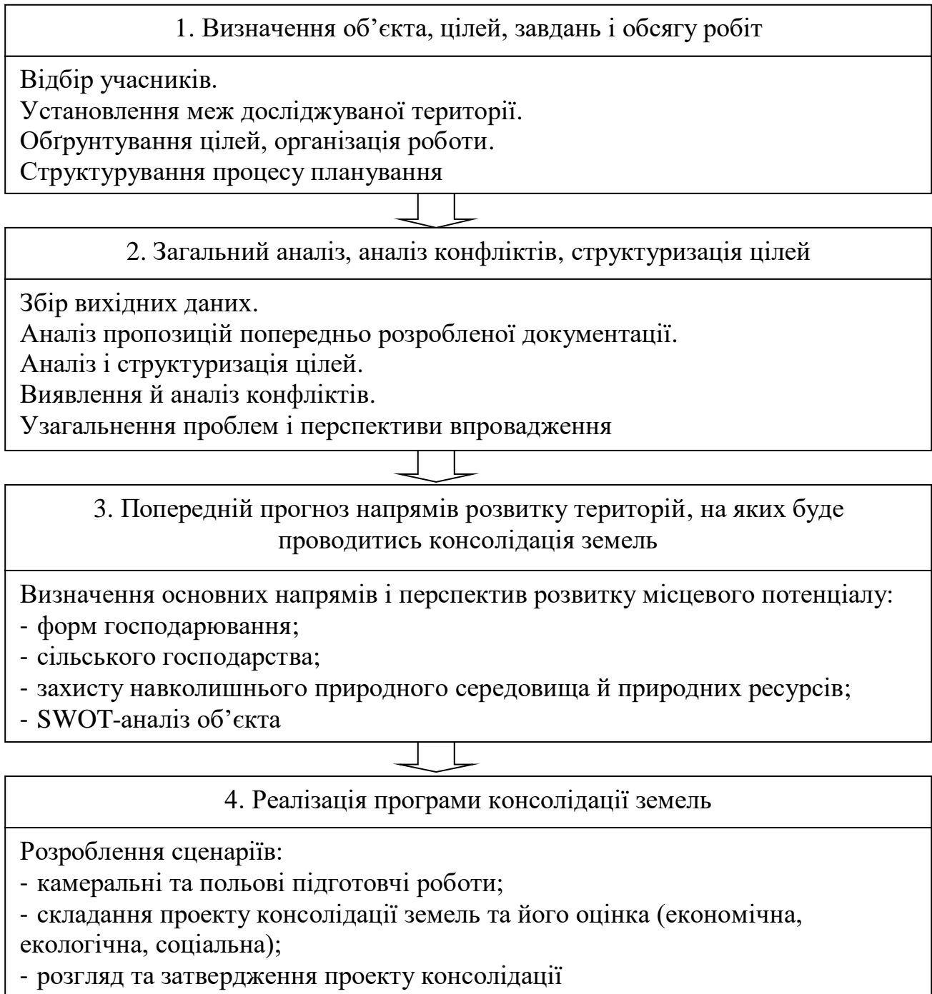
Рис. 4. Логічна схема процесу консолідації земель сільськогосподарського призначення