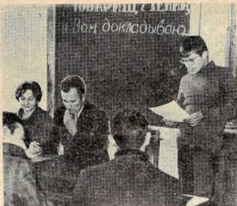
Активно проходить Ленінський залік у третьокурсників факультету механізації сільського господарства.