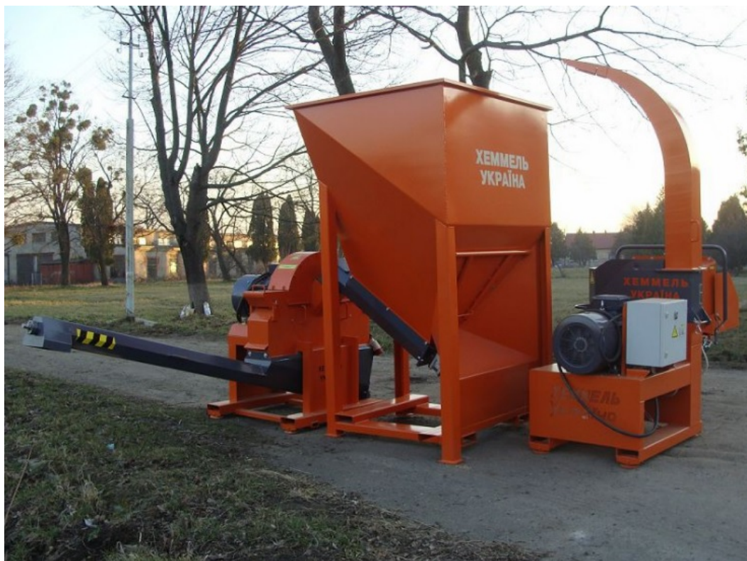
Рис. 2. Лінія подрібнення сухих шматкових відходів RK 847 [6].

Вона складається із цеху подрібнення, сушильної установки, накопичувальних та проміжного бункерів, дробарки кінцевого дроблення, грануляторів, просіювача, охолоджувача та затарювальної машини.