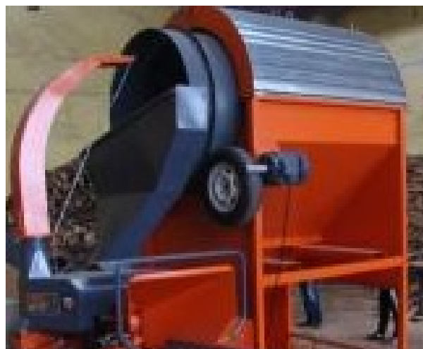
Рис. 3. Калібровочне барабанне сито SB 1025 [8].

Для рівномірної подачі тріски на вторинний подрібнювач лінія обладнана бункером-дозатором, звідки через завантажувальний шнек з приводом від електродвигуна потужністю 2,2 кВт матеріал подається безпосередньо до вторинного подрібнювача.