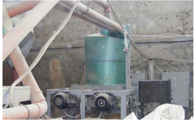
Рис. 6. Гранулятори з накопичувальним бункером.

З накопичувальних бункерів сировина в автоматичному режимі шнековими транспортерами подається до проміжного бункера для сировини (рис. 5), звідки пневмотранспортером направляється в накопичувальний бункер грануляторів (рис. 6).