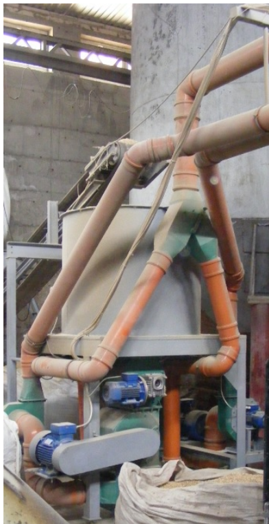
Рис. 5. Проміжний накопичувальний бункер для сировини.

Суха стружка направляється в накопичувальні бункери напряму. Також минаючи лінії дроблення в накопичувальні бункери поступає тирса з цеху первинної обробки деревини. Однак перед цим вона висушується в сушарці стрічкового типу.