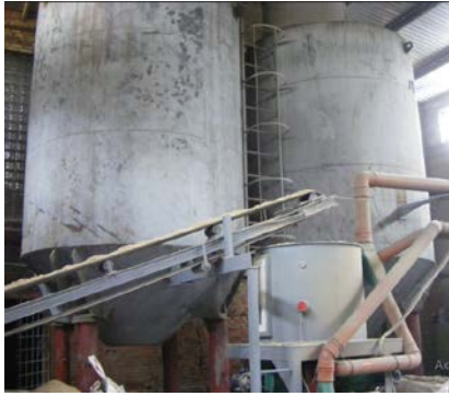
Рис. 4. Накопичувальні бункери сировини після попереднього дроблення.