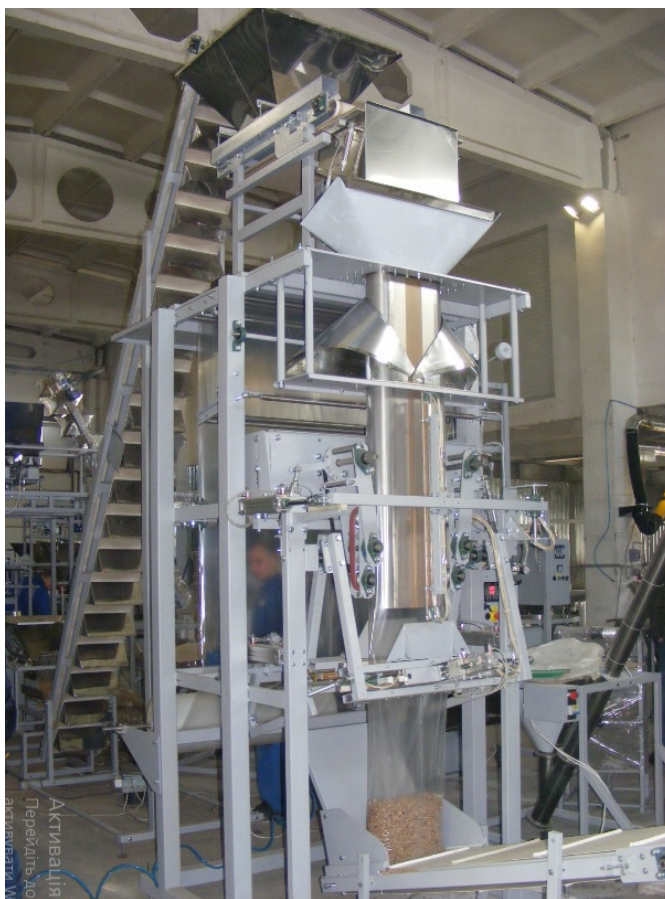
Рис. 8. Затарювальна машина.