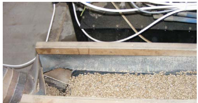
Рис. 7. Паливні гранули з гранулятора з гранулятора на стрічці транспортера

З грануляторів вироблені паливні гранули (рис. 7) стрічковим та шнековим транспортерами направляються на просіювач і охолоджувач, а звідти – на лінію затарювання (рис. 8).