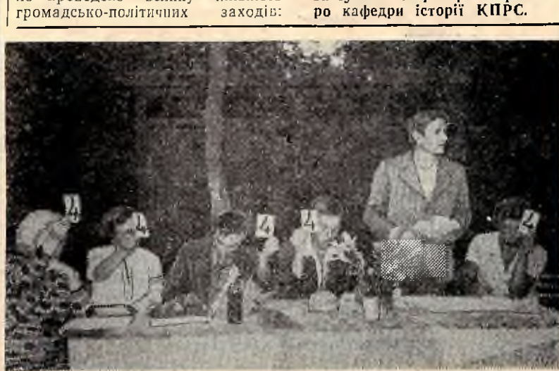
В журі КВНу — викладачі академії.