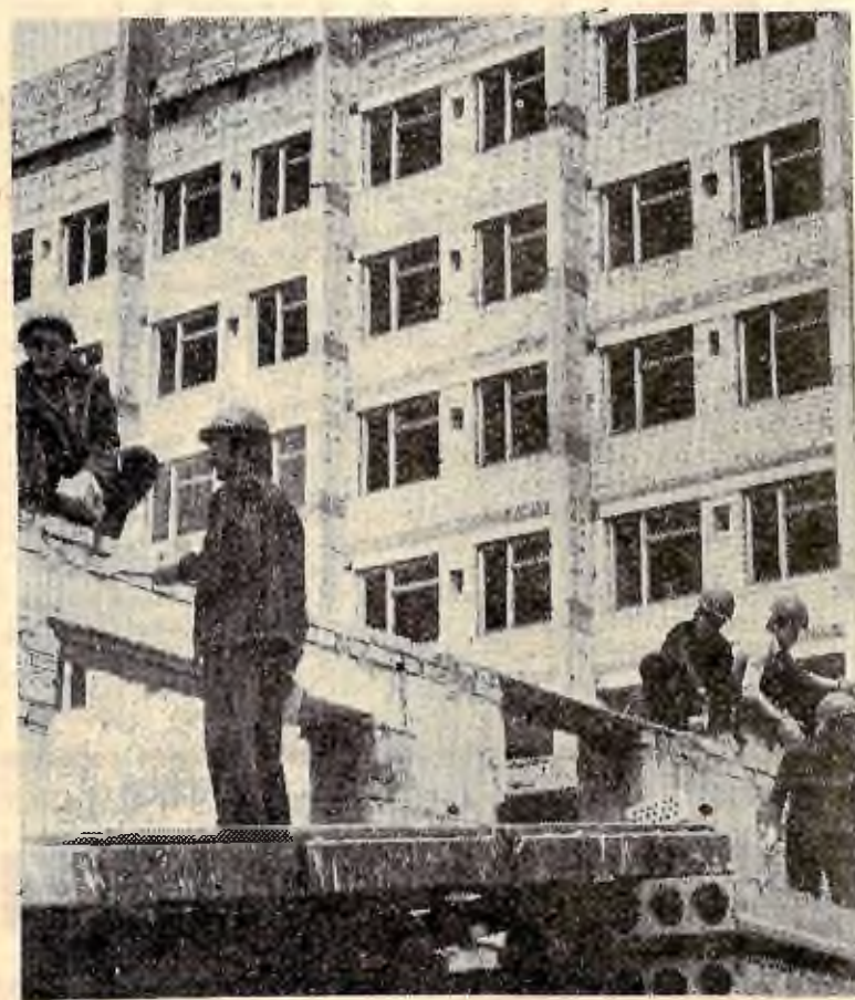
Першокурсники працюють на будівництві учбового корпусу ФГП.