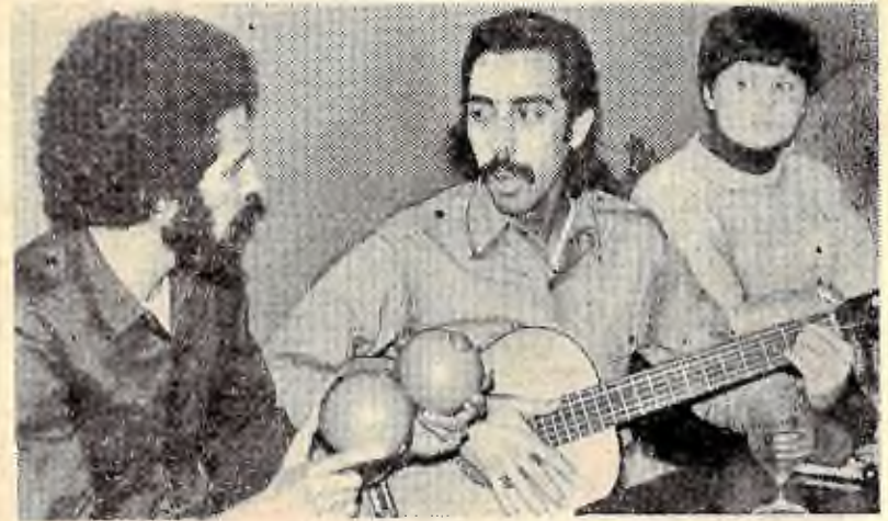
Кубинські студенти з факультету захисту рослин — члени агітбригади.