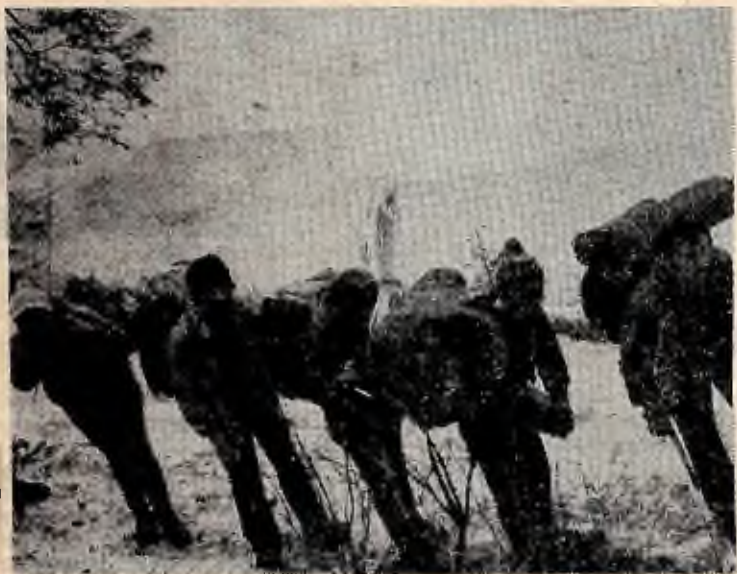
По всій країні подорожують слухачі туристського відділення ФГП.

В 1980—81 навчальному році продовжить свою роботу секція керівників драматичних колективів, відкриється секція