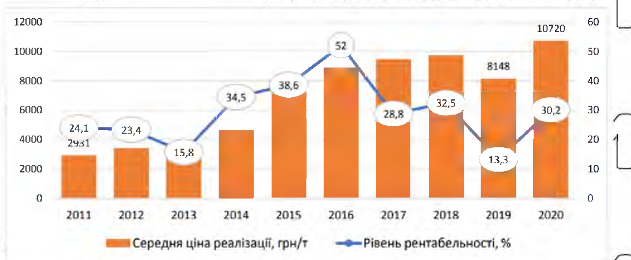
Рис. 1.4 – Рентабельність та середня ціна реалізації сої на внутрішньому ринку України

Зокрема, за даними Державної служби статистики, обсяг капітальних інвестицій в українське сільське господарство становить близько 10% від загального обсягу інвестицій.