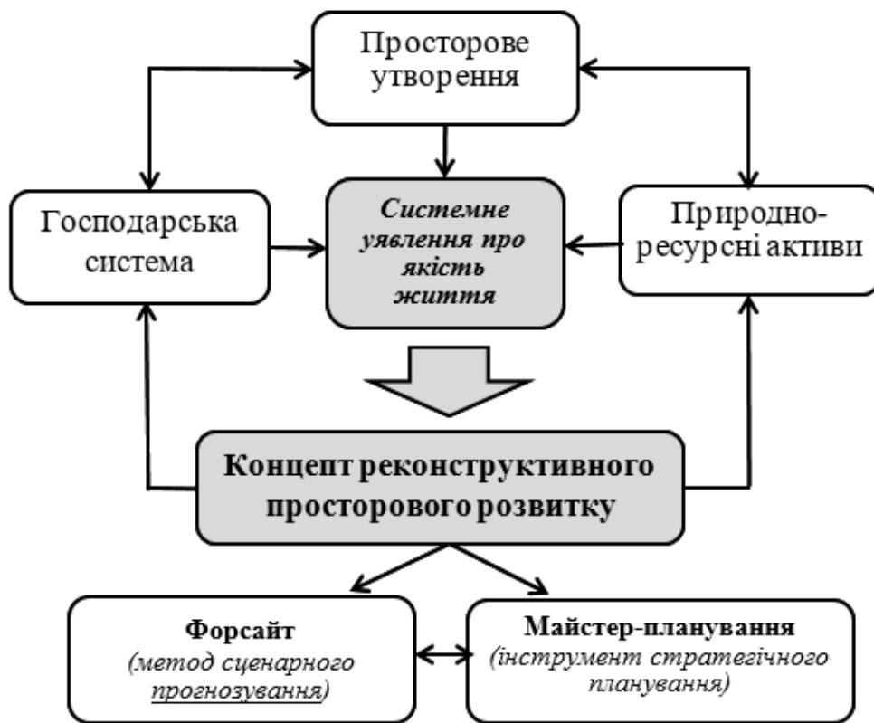
Рисунок 2. Концепт реконструктивного просторового розвитку на базі природно-ресурсних активів з урахуванням чинників якості життя

Далі, схеми управління реконструктивним розвитком просторових утворень мають проводитися за деякими напрямками, однак фрактал управління залишається однаковим. У нашому випадку, увага зосереджена на співвідношенні та взаємодії двох ключових процесів, пов'язаних із упорядкуванням господарської системи та питаннями ефективного використання природно-ресурсних активів (рис. 2). У даному разі, уявлення населення про бажаний розвиток просторового утворення, по-суті, визначає системне уявлення про якість життя територіальної спільноти, і таким чином, як прямо, так і опосередковано, конкретизує управлінських дії щодо упорядкування визначених процесів в рамках концепту просторового розвитку.