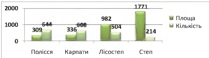
Рис. 1. Кількість розсадників (шт.) та площа (га) станом на 01.01.19 р.

В сучасних умовах за відсутності з 2016 року бюджетного фінансування підприємств лісової галузі, суттєво зросла актуальність значення залучення позабюджетних коштів. Одним із таких важливих напрямів є розсадництво, зокрема, вирощування декоративного садивного матеріалу. Для його продукування у підприємств галузі є усе необхідне (землі, досвідчені виконавці тощо) (рис. 1), а попит на декоративні саджанці стабільно зростає і буде зростати.