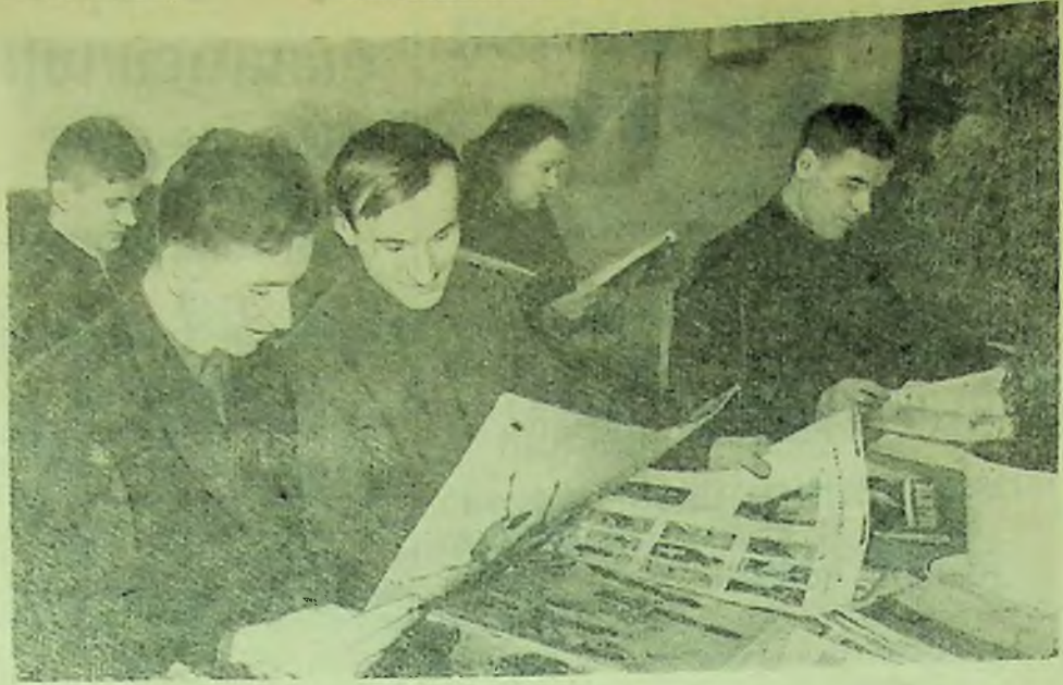
Щодня в обідню перерву, після роботи до агітпункту виборчої дільниці № 38 приходять робітники, службовці, студенти, викладачі академії. До їх послуг багато газет, журналів і періодичних видань з країни народної демократії. На знімку: в агітпункті.