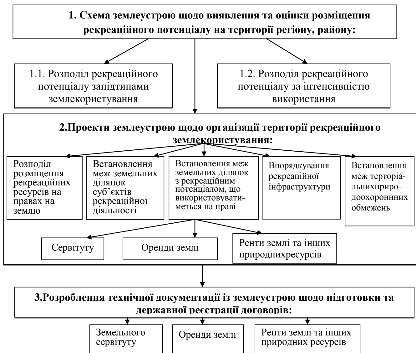
Рис. 2. Логічно-смысловая модель методологічного процесу організації рекреаційного землекористування

Землі природно-заповідного фонду та рекреаційного призначення в цілому у структурі землекористування України займають тільки 6,5%. Площа земель природно-заповідного, рекреаційного, оздоровчого та історико-культурного призначення в розрізі землекористувачів господарського використання земель хоча і збільшилася за період 2001–2013 рр. на 30,46% і становить 443,7 тис.га, проте в деяких регіонах України відбулося їх зменшення. Така ситуація говорить про багаторічне ігнорування величезного економічного потенціалу рекреації, недооцінку доцільності освоєння відповідних туристичних і лікувально-оздоровчих ресурсів, що охоплені останніми роками глибокою системною кризою.