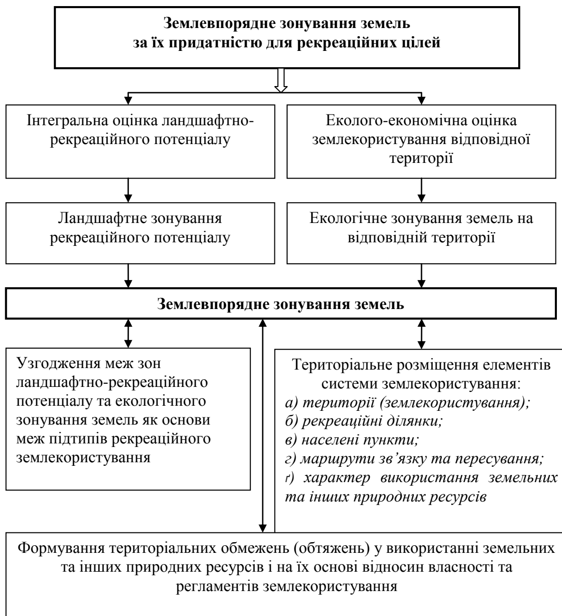
Рис. 3. Логічно-сміслова схема методології землевпорядного зонування земель за їх придатністю для рекреаційних цілей

Прз – площа земель відповідного підтипу рекреаційного землекористування, що приймається за даними обстежень або документації із землеустрою, га.