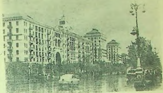
Центральна магістраль столиці України — Хрещатик.

тук. До війни ширина вулиці дорівнювала 39 метрам, тепер же її ширина досягає 74 метрів. Ідемо до Дніпра. Робимо зупинку біля моста пішоходів, будівництво якого завершиться до початку наступного пляжного сезону.