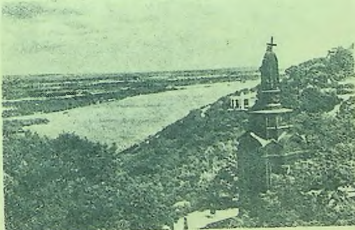
На схилах Дніпра.

Раніше на місці Хрещатика був великий яр, вкритий лісом, в якому водилося багато диких птахів. Полюючи на них, люди розвішували сітки. Тому спочатку Хрещатик називали Перевіссям. Потім в лісі протоптали багато стежок, які перехрещувалися. Звідси і пішла назва Перехрещення, Хрещатик.