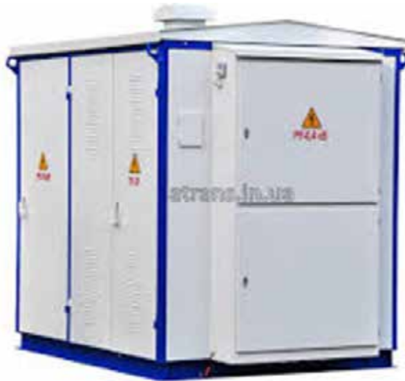
Рис. 1.1. Трансформаторна підстанція 10/0,4 кВ

Трансформаторні підстанції 10/0,4 кВ відіграють ключову роль у передачі електроенергії від магістральних ліній до кінцевих споживачів. Менеджмент обслуговування в цьому контексті включає ряд критичних завдань, таких як моніторинг стану обладнання, своєчасна діагностика та ремонт, а також впровадження передових технологій для зниження втрат і підвищення надійності системи[1].