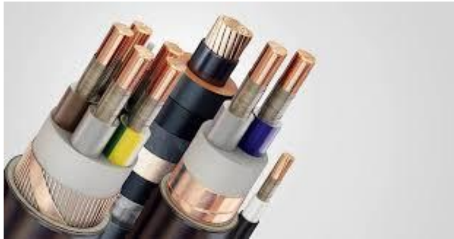
Рис. 2.1 Зображення розрізу кабелю

Основною причиною збільшення перерізу проводу є зростання навантаження на лінії електропередачі. У міру зростання споживання електроенергії, особливо у промислових регіонах та в міських агломераціях, старі мережі стають неспроможними задовольнити попит на електроенергію. Це призводить до перевантаження ліній, зростання втрат енергії, нестабільності напруги та частих аварійних ситуацій.