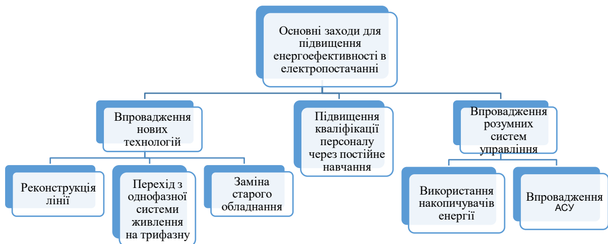
Рис.1.1. Блок-схема основних заходів для підвищення енергоефективності в електропостачанні

Застосування цих організаційних заходів не лише підвищує ефективність роботи підприємства, але й сприяє сталому розвитку та зменшенню негативного впливу на навколишнє середовище.