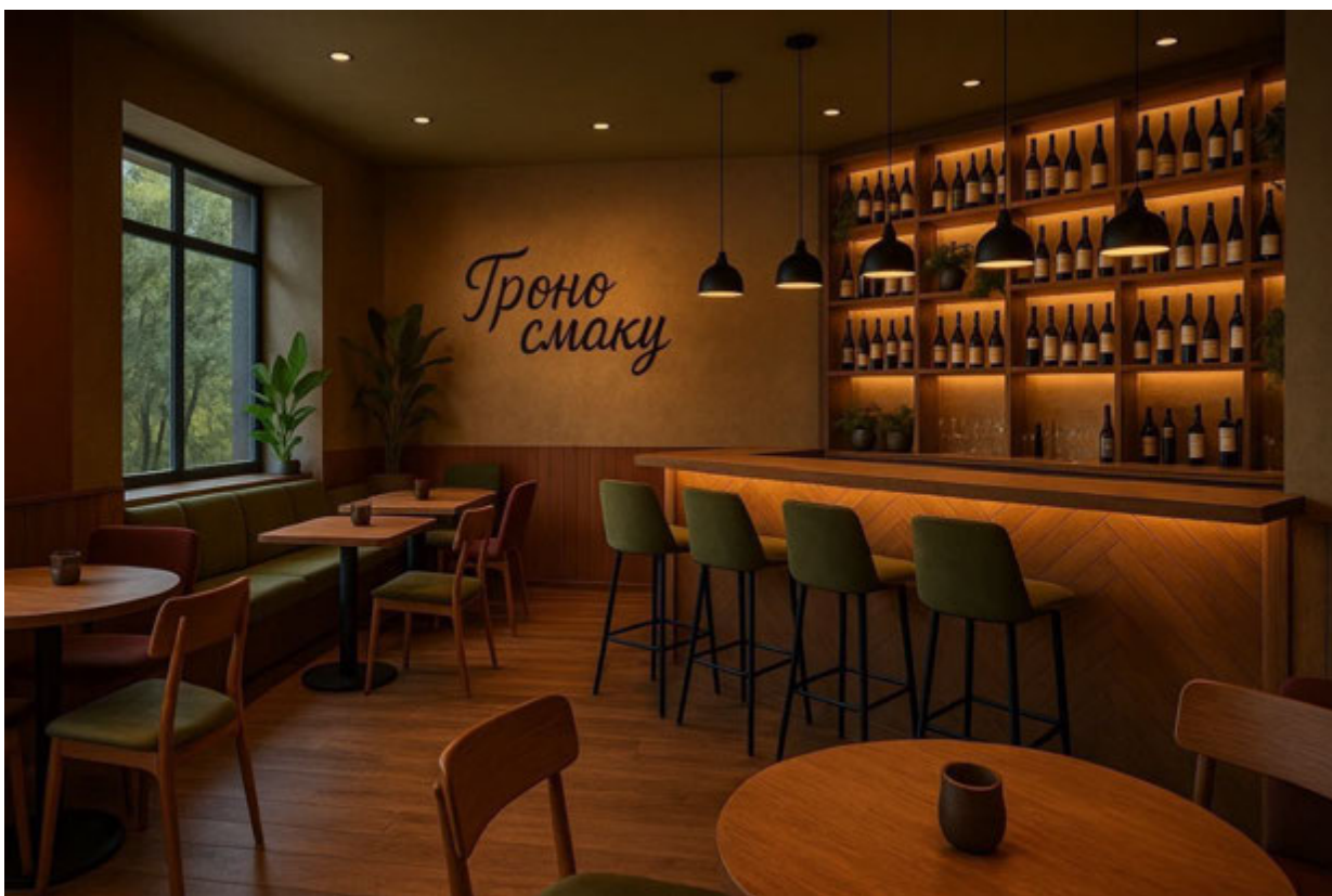
Рис 3.1. Дизайн закладу