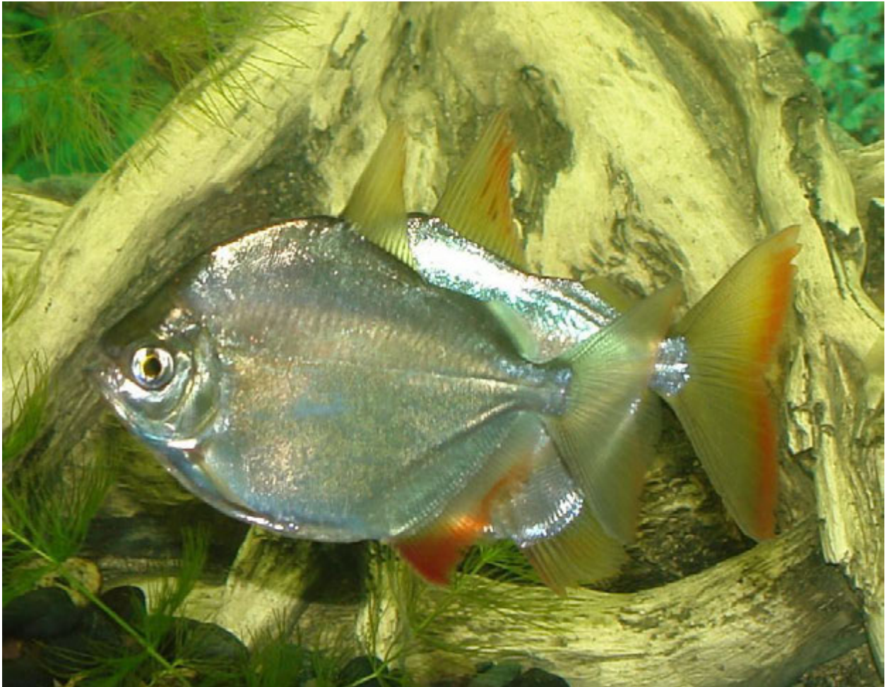
Рис. 4. Статевий деморфізм, спереду самка, позаду самець

поширеною практикою є класти шар кульок на дно акваріума, якщо розмноження бажане в спільному акваріумі. Ідея полягає в тому, що ікра потрапляє між проміжками в кульках, де вона може розвиватися в спокої: інші риби не можуть дістатися до неї протягом цього вразливого періоду, а коли мальки врешті-решт піднімаються, вони мають шанс ухилитися від хижаків.