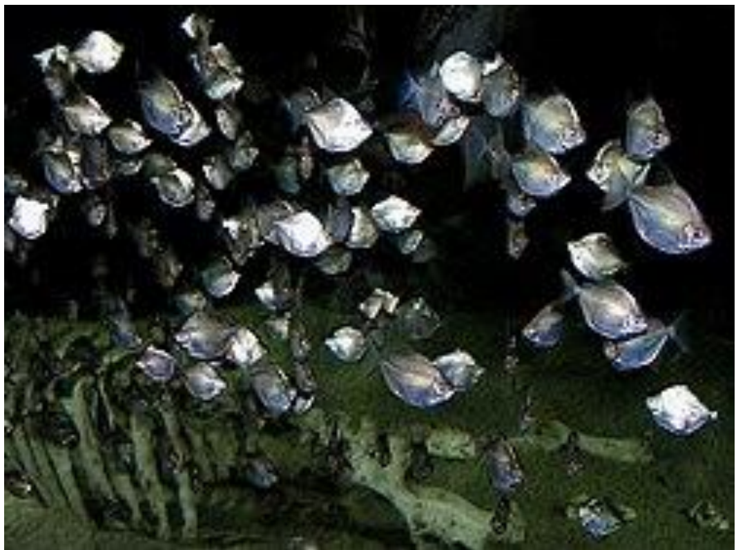
Рис. 3 Metynnis argenteus

Ідентифікація. M. argenteus має кругле тіло та стиснуті з боків, за нормальних умов має однорідний сріблястий колір, іноді з розмитим червоним забарвленням на плавниках та навколо горла. Зазвичай їх продають молодими особинами довжиною близько двох дюймів, вони мирні, мешкаючи на косяках. Дорослі самки в неволі можуть досягати довжини від п'яти до шести дюймів, тоді як самці, як правило, трохи менші. У хорошому стані самки, як правило, мають більш повний черевце, ніж самці, тоді як самці розвивають трохи довші плавники з віком. Під час залицяння та розмноження у самців розвиваються дві великі, дуже помітні чорні плями, одна над одною, одразу за основою грудних плавців, червоне забарвлення плавців поглиблюється, і з'являються контрастні чорні облямівки. Деякі самці також можуть мати інші темні мармурові плями на боках. Самки демонструють незначні, або взагалі відсутні, зміни в кольорі під час залицяння та розмноження.