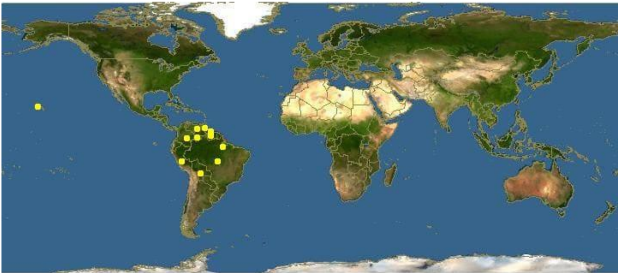
Рис. 1. Метініс Сріблястий та Звичайний ( Metynnis ) місця розповсюдження

Metynnis argenteus — це вид риб родини сєррасальмїд, ендемічний для басейну річки Тапажос у Бразилії. Це один з видів, відомих в акваріумній торгівлі як «срібний долар». M. argenteus зазвичай вважається архетипним срібним доларом, хоча його та дуже схожого M. hypsauchen часто плутають.[2,3]