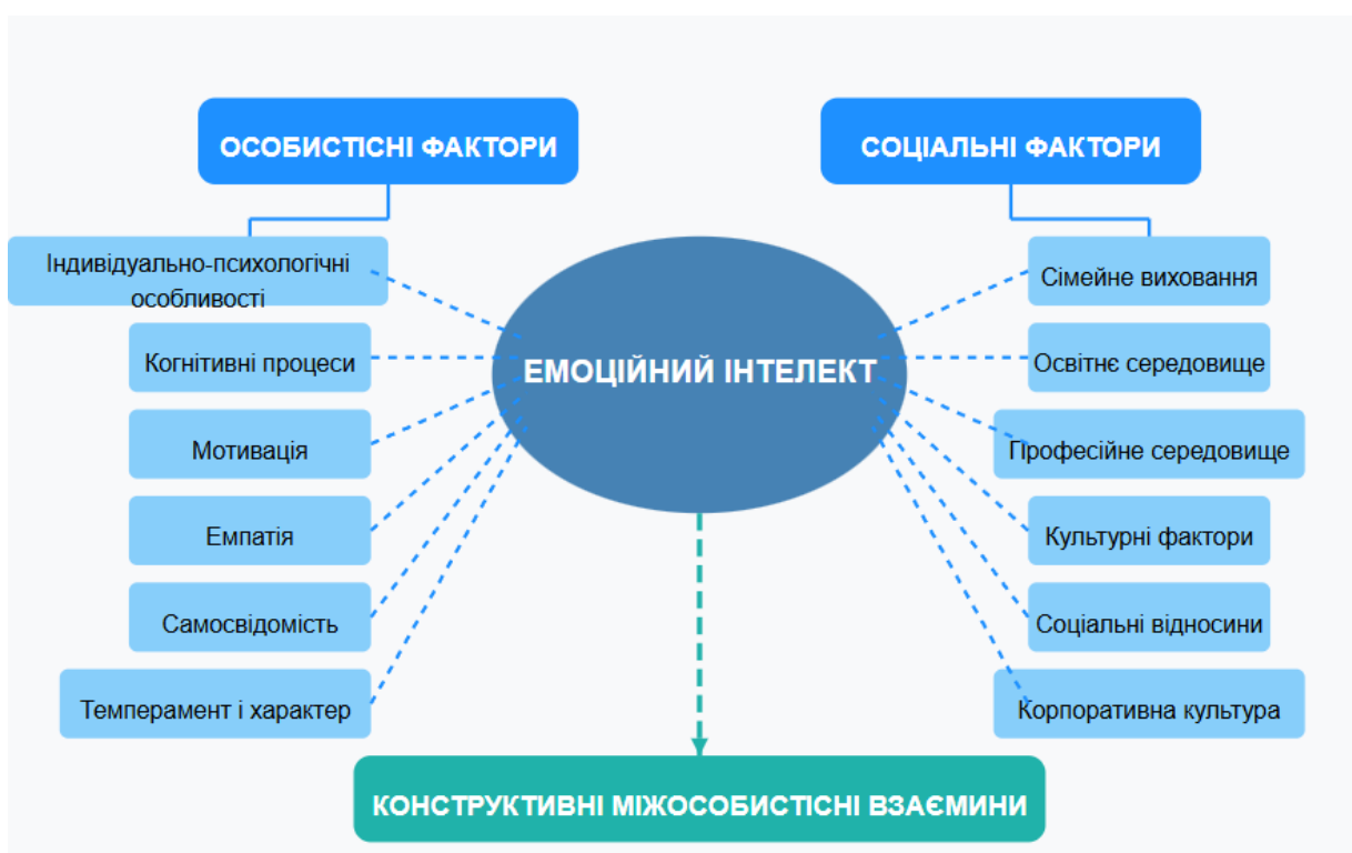
Рис. 1.1. Модель взаємодії особистісних та соціальних факторів у розвитку емоційного інтелекту

Одним із важливих аспектів розвитку емоційного інтелекту є взаємодія особистісних та соціальних факторів. Для кращого розуміння цієї взаємодії розглянемо модель, яка відображає ключові фактори розвитку емоційного інтелекту та їх взаємозв'язки (рис. 1.1). Дана модель демонструє, що формування емоційного інтелекту відбувається на перетині внутрішніх (особистісних) та зовнішніх (соціальних) чинників, що створює унікальну конфігурацію умов для розвитку емоційної компетентності кожної людини.