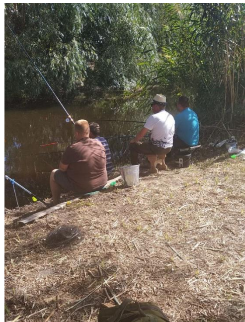
Рис. 2.1. Зони для рибальства