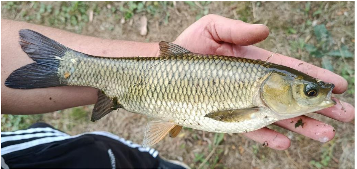
Рис. 1.1. Білий амур ( Stenopharyngodon idella Val.)

Білий амур ( Stenopharyngodon idella Val.) – представник родини корошових ( Cyprinidae ) і єдиний вид у складі роду Stenopharyngodon . Природний ареал поширення виду охоплює басейни великих річок Східної Азії – Янцзи, Сицзян та Амур, звідки бере початок його видова назва. Внаслідок цілеспрямованої акліматизаційної роботи у середині ХХ століття вид було успішно інтродуковано у водойми багатьох країн Європи, Північної Америки та Близького Сходу. В Україні білий амур став невід'ємним компонентом полікультурного ставового рибництва з 1960-х років і нині є другим за господарською значущістю представником корошових після власне коропа (рис.1.1.) [38, 39, 41].