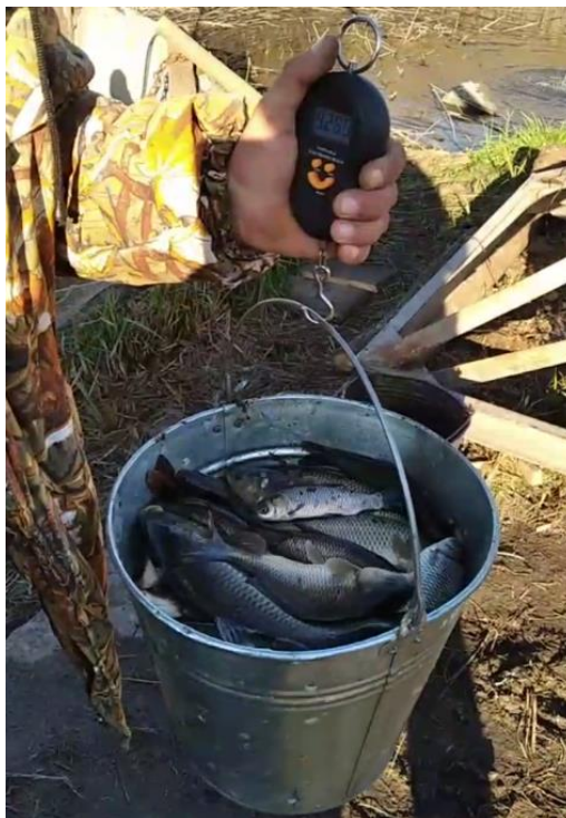
Рис. 2.4. Зважування риби

Облік щільності посадки рибопосадкового матеріалу проводили шляхом поштучного підрахунку однорічок коропа та білого амура при зарибленні ставу. Зважування партій риби виконували на електронних терезах із похибкою не більше \pm 5 г, після чого визначали середню масу екземпляра у кожній віковій групі. Дані щодо посадки заносили до робочого журналу із зазначенням дати, кількості, маси та видового складу (Рис.2.4) [3, 34].