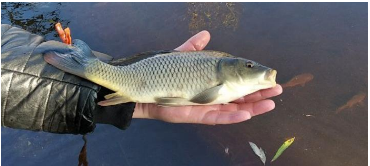
Рис. 1.2. Короп лускатий ( Cyprinus carpio L. )

Короп звичайний ( Cyprinus carpio L. ) є провідним об'єктом ставового рибництва в Україні та одним із найбільш культивованих видів прісноводних риб у світі. За даними Інституту рибного господарства НААН України, частка коропа у структурі вирощуваної ставової риби становить 55–65 %, що зумовлено сприятливими біологічними особливостями виду – високим темпом росту, всеїдністю, толерантністю до коливань абіотичних факторів водного середовища і високими харчосмаковими властивостями м'яса. Світове виробництво коропа у системах аквакультури перевищує 4 млн тонн на рік, при цьому країни Центральної та Східної Європи традиційно орієнтуються на екстенсивну та напівінтенсивну ставову культуру (рис.1.2.) [10, 16, 35].