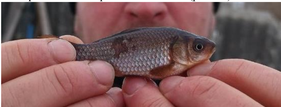
Рис. 2.2. Карась сріблястий – Carassius gibelio

Окрім планових об'єктів культивування, у дослідній водоймі присутня стійка популяція срібного карася ( Carassius gibelio Bloch ), яка сформувалася природним шляхом за рахунок потрапляння молоді з поверхневим стоком та паводковими водами р. Золотоношка. Цей вид представлений у ставі переважно карликовою формою із середньою довжиною тіла 5–6 см та масою близько 10–15 г, що є типовим наслідком перенаселення та обмеженості кормової бази в умовах неспускних водойм. Срібний карась належить до категорії проміжних малоцінних видів, які складають харчову конкуренцію коропа за бентосний корм та детритоїдні організми, тому його чисельність потребує контролю в межах прийнятних значень (рис.2.2.).